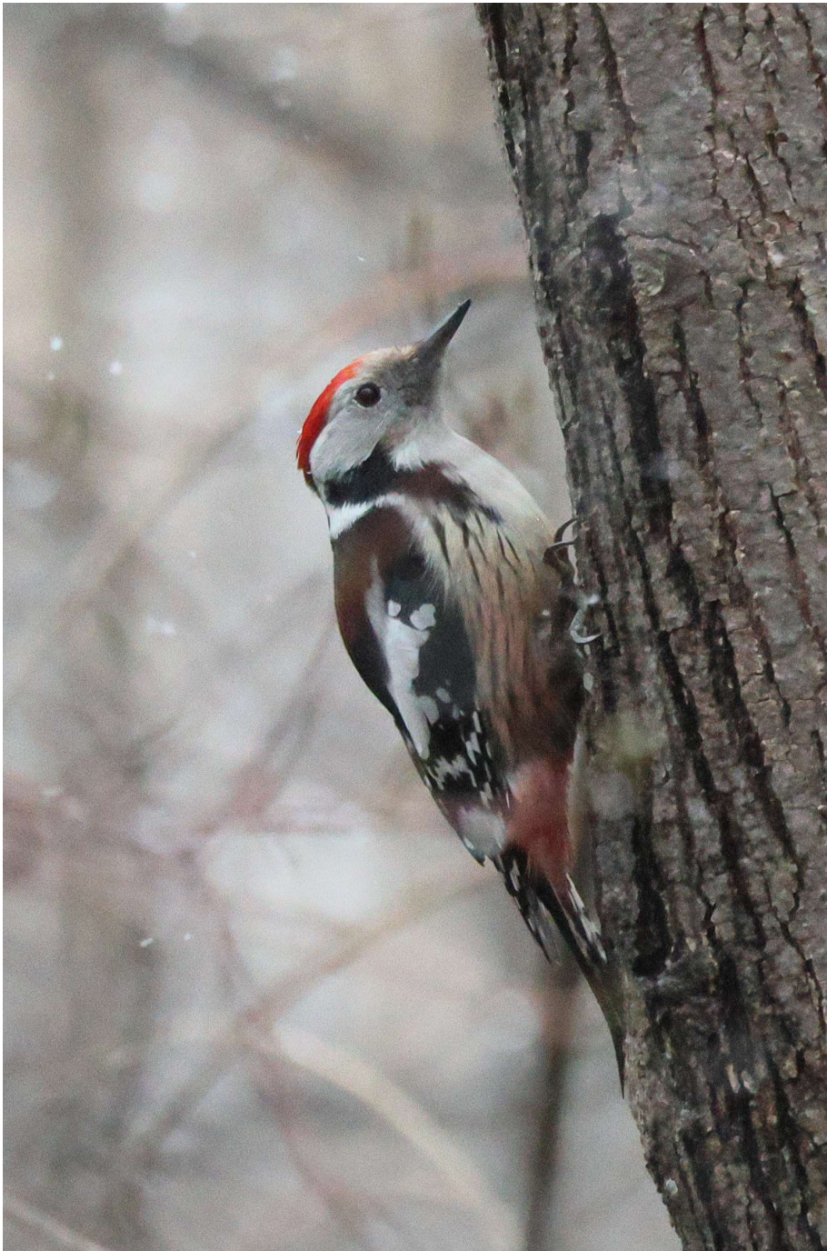
Mittelspecht (A. Schade)

Wir lauschen den morgendlichen Sängern, mit Kohlmeise, Buchfink und Zilpzalp - letzterer noch nicht allzu lange zurück aus dem Winterquartier.