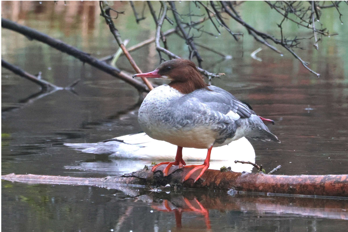
Gänsesäger (A. Schade)

Ein Stopp am Nymphenburger Schloss bringt auch Wetterschutz für eine Brotzeit, bevor die Vogelwanderung weitergeht.