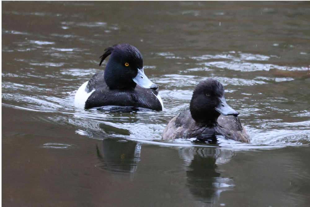
Reiherenten (A. Schade)

Anschließend geht es aus dem Park heraus, weiter durch einen Lohwaldbereich und einen Stadtbezirk mit schönen, alteingewachsenen Gärten, wo uns kurz vor der Einkehr noch eine Mönchsgrasmücke besonders erfreut, die sich - ganz offen sitzend - beim Singen zusehen lässt.