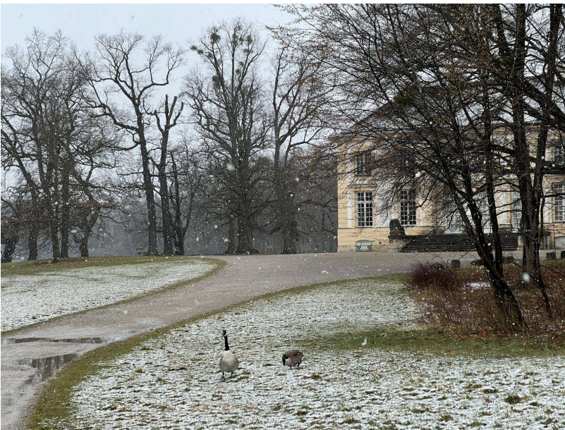
Badenburg im Nymphenburger Schlosspark mit Kanadagänsen (A. Schade)

Wir treffen uns frühmorgens am Nymphenburger Schloss. Trotz des Wintereinbruchs mit nasskaltem Wetter ist keiner der Teilnehmer abgesprungen – wunderbar!