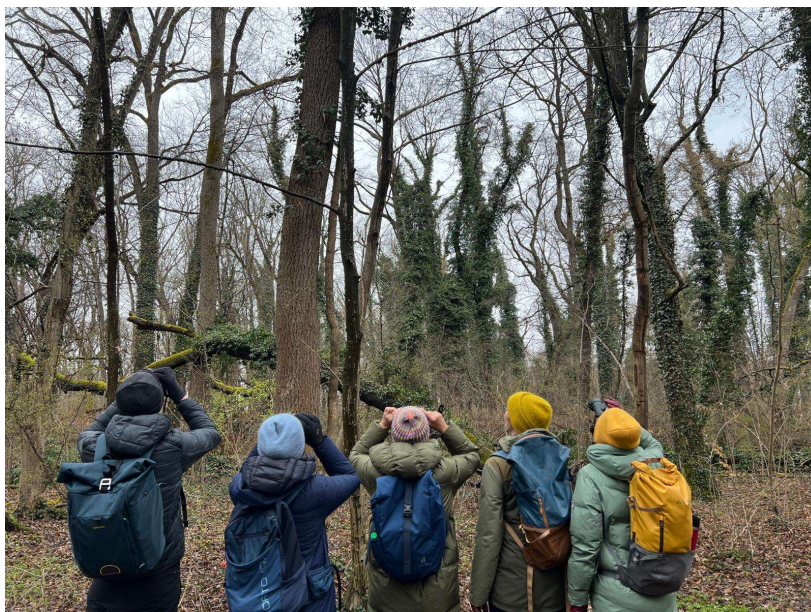
Birdinggruppe im Lohwald (A. Schade)

Erfrischt und mit besserem Wetter geht es durch ein weiteres Waldgebiet, die hohen Bäume malerisch mit Efeu bewachsen.