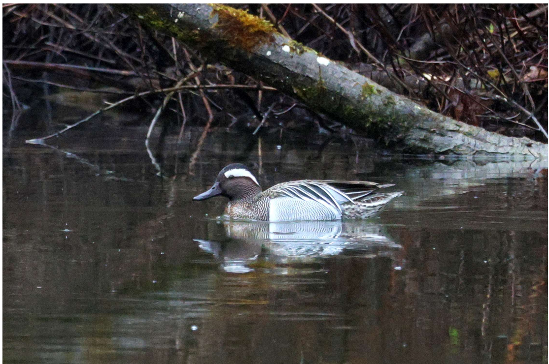
Knäkente (A. Schade)