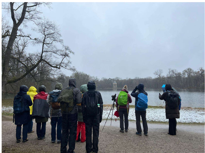
Birdinggruppe im Nymphenburger Schlosspark, mit Apollotempel (A. Schade)