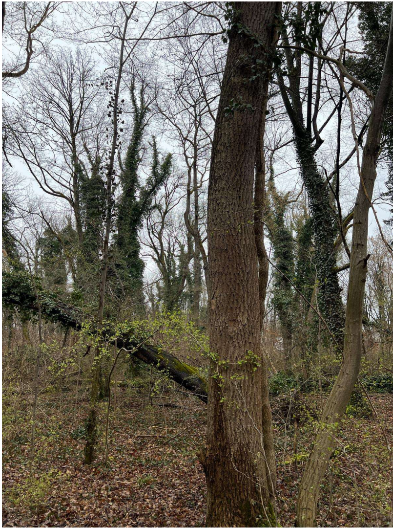
Lohwaldgebiet mit Efeu (A. Schade)