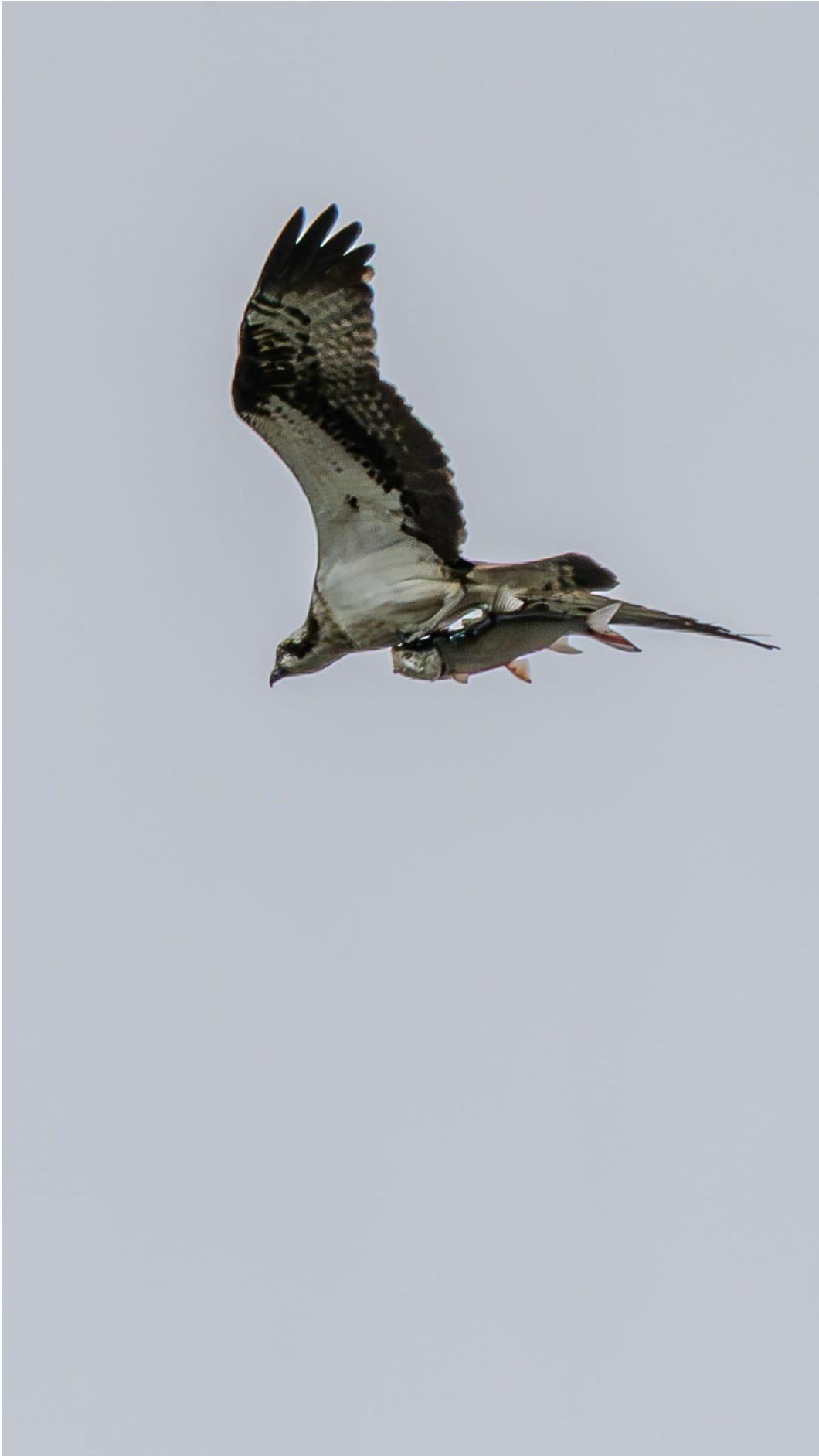
Fischadler / Frank A.