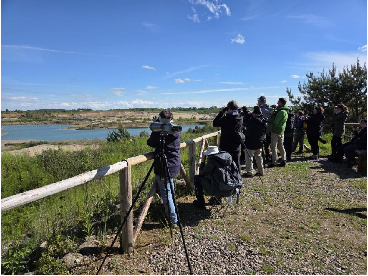
↑ Kiesgrube Groß Ziethen / Ines K. # ↓ Aussichtsturm Stützkow / Ines K.