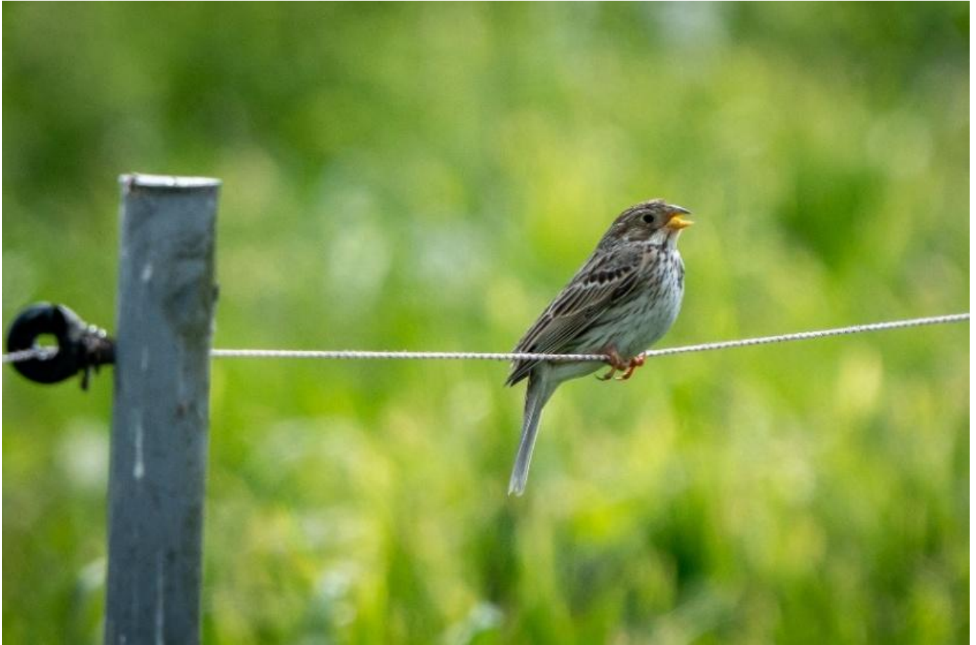
↑ Grauammer / Ulrike A. # ↓ Wendehals / Ulrike A.