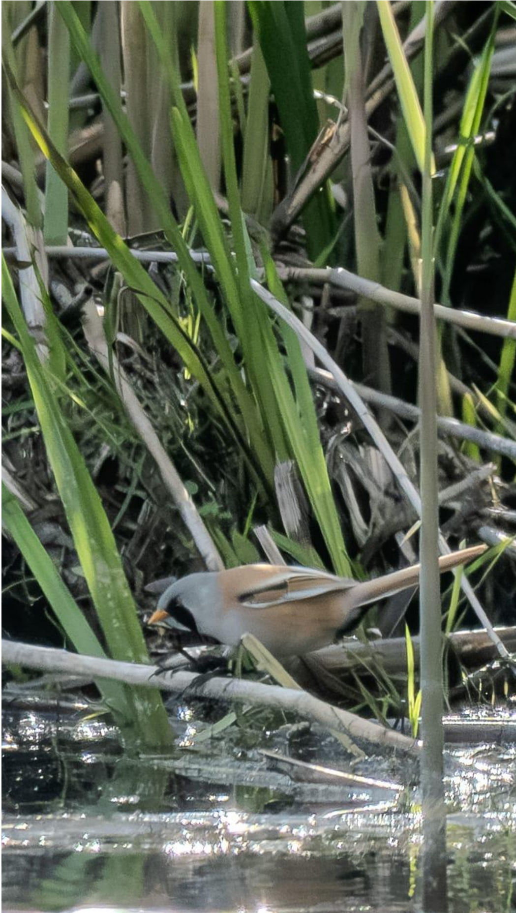
Bartmeise / Frank A.