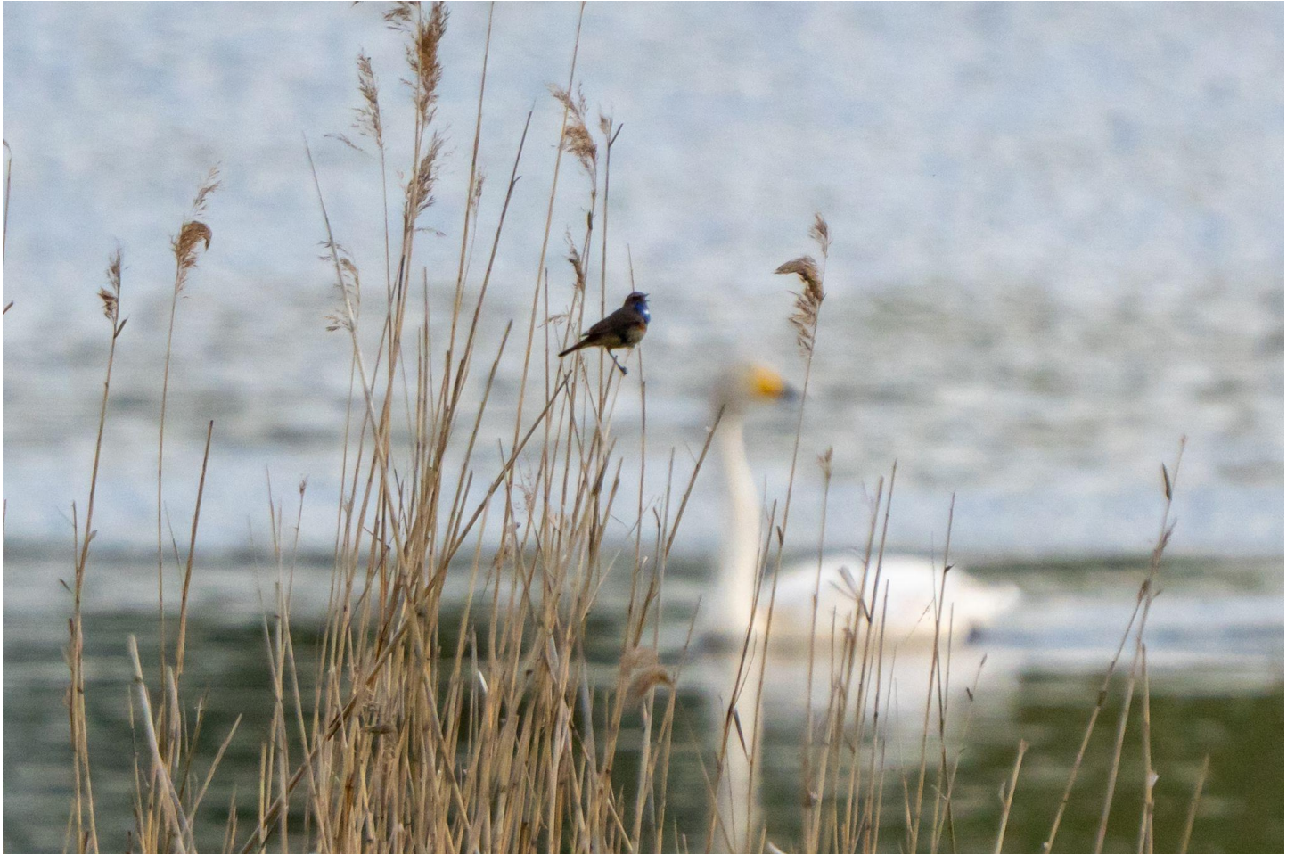
↑ Blaukehlchen & Singschwan / Ulrike A. # ↓ Sonnenuntergang / Mercedes F.