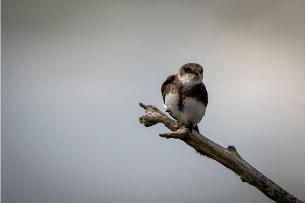
↑ Uferschwalbe / Ulrike A. # ↓ Braunkehlchen / Ulrike A.