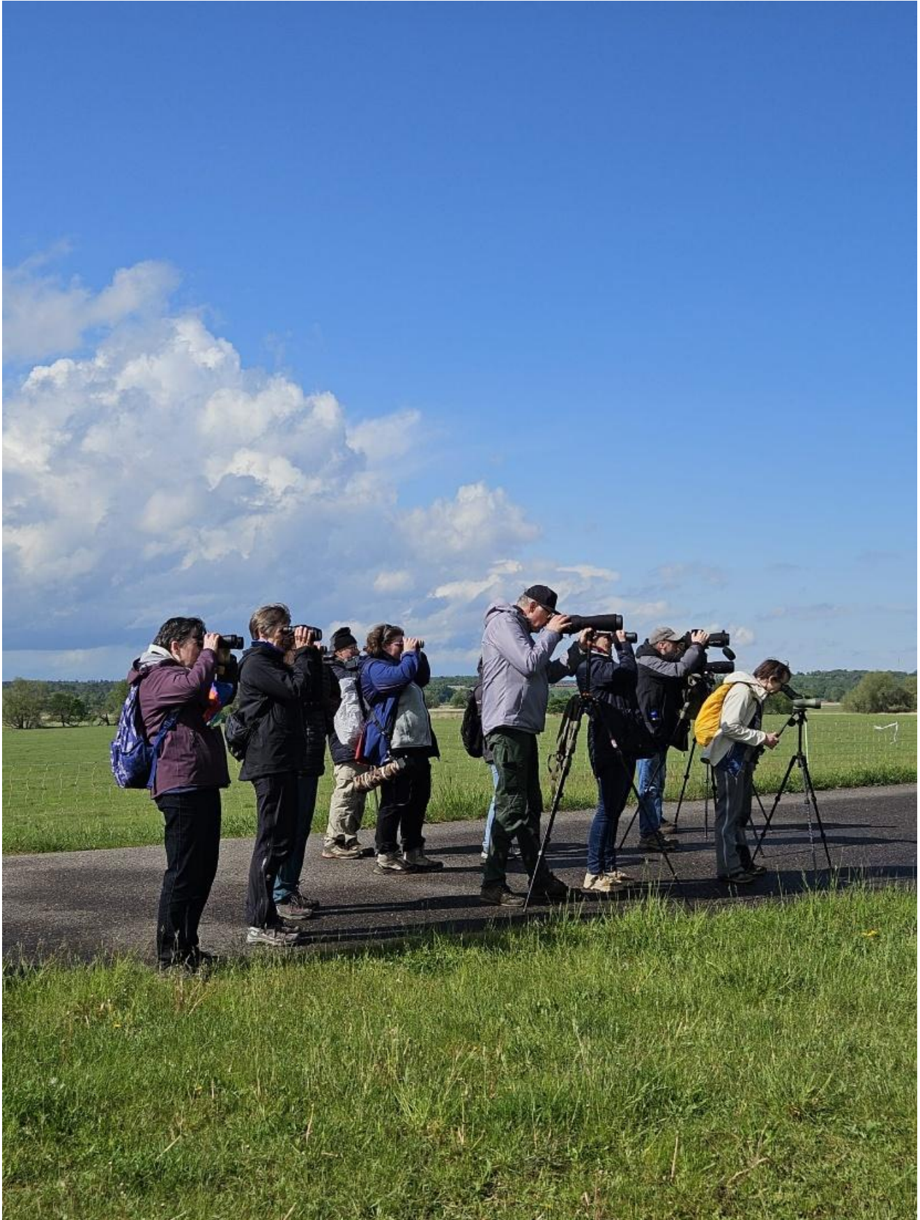
Trockenpolder Stolpe / Silke A.