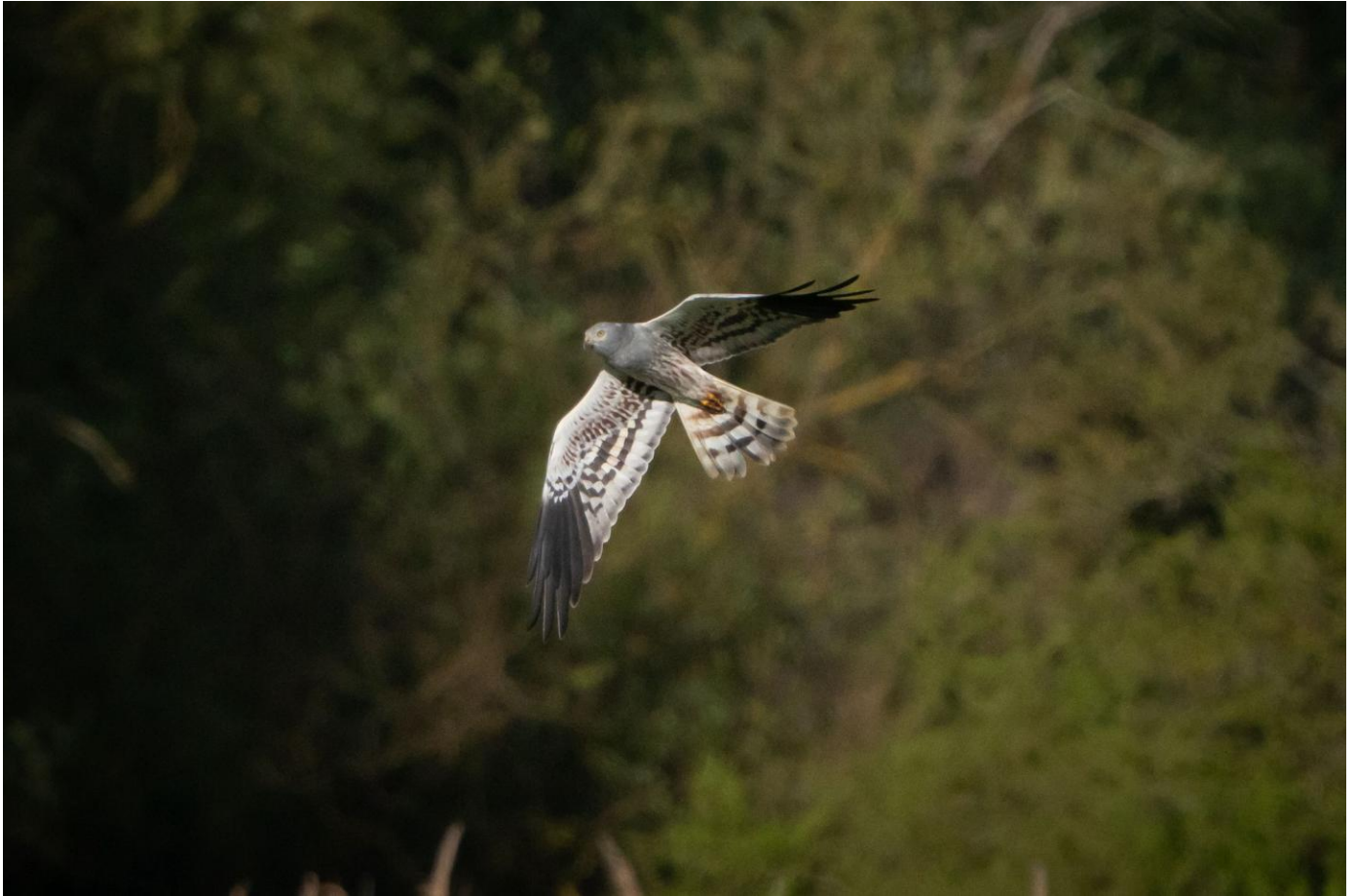
↑ Wiesenweihe / Ulrike A. # ↓ Sprosser / Ulrike A.