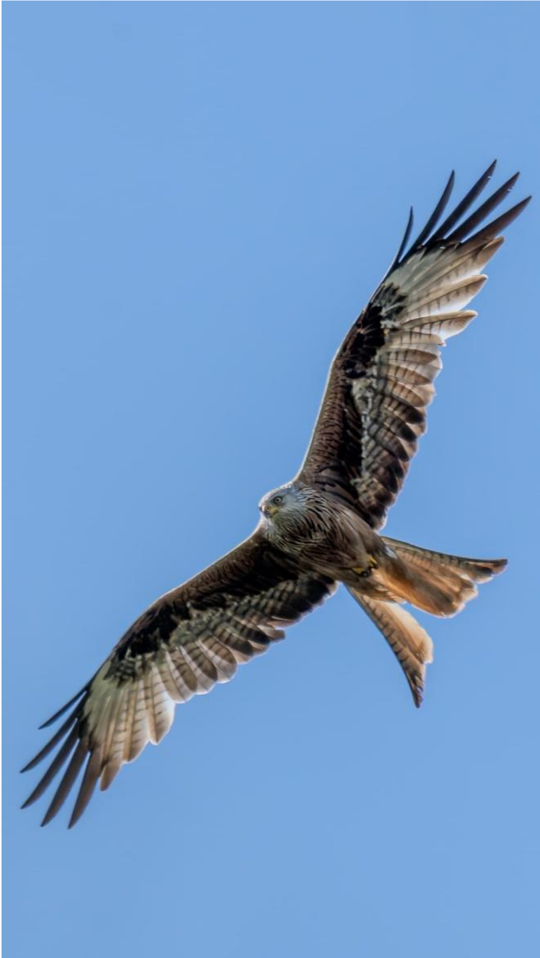
Rotmilan / Frank A.