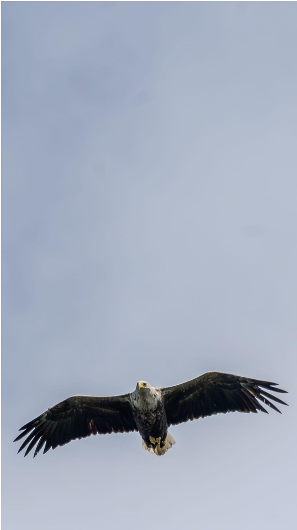
Seeadler / Frank A.