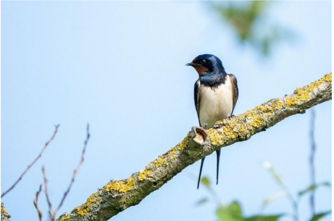
↑ Rauchschwalbe / Ulrike A. # ↓ Mehlschwalbe / Ulrike A.