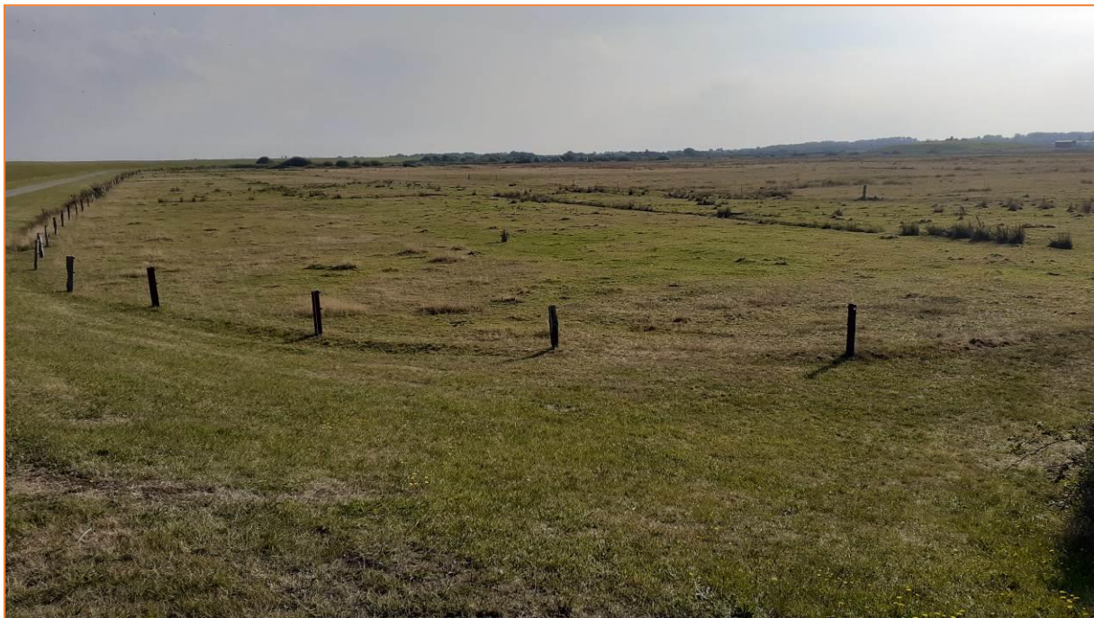
Binnenweiden östlich vom Dorf Langeoog

Nach diesen ersten und schönen Eindrücken geht es zum leckeren Abendessen in unser gemütliches Hotel Bethanien.