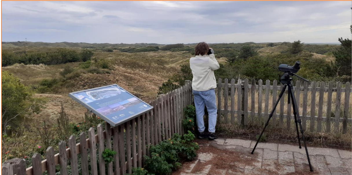
Dünenlandschaft am Vogelwärterhäuschen

Wir radeln weiter in Richtung Osten. Die beiden nächsten Stopps machen wir an der Vogelwärterhütte mit einem Blick über die wunderbare Dünenlandschaft und an der Meierei, wo wir für eine Kaffeepause kurz einkehren.