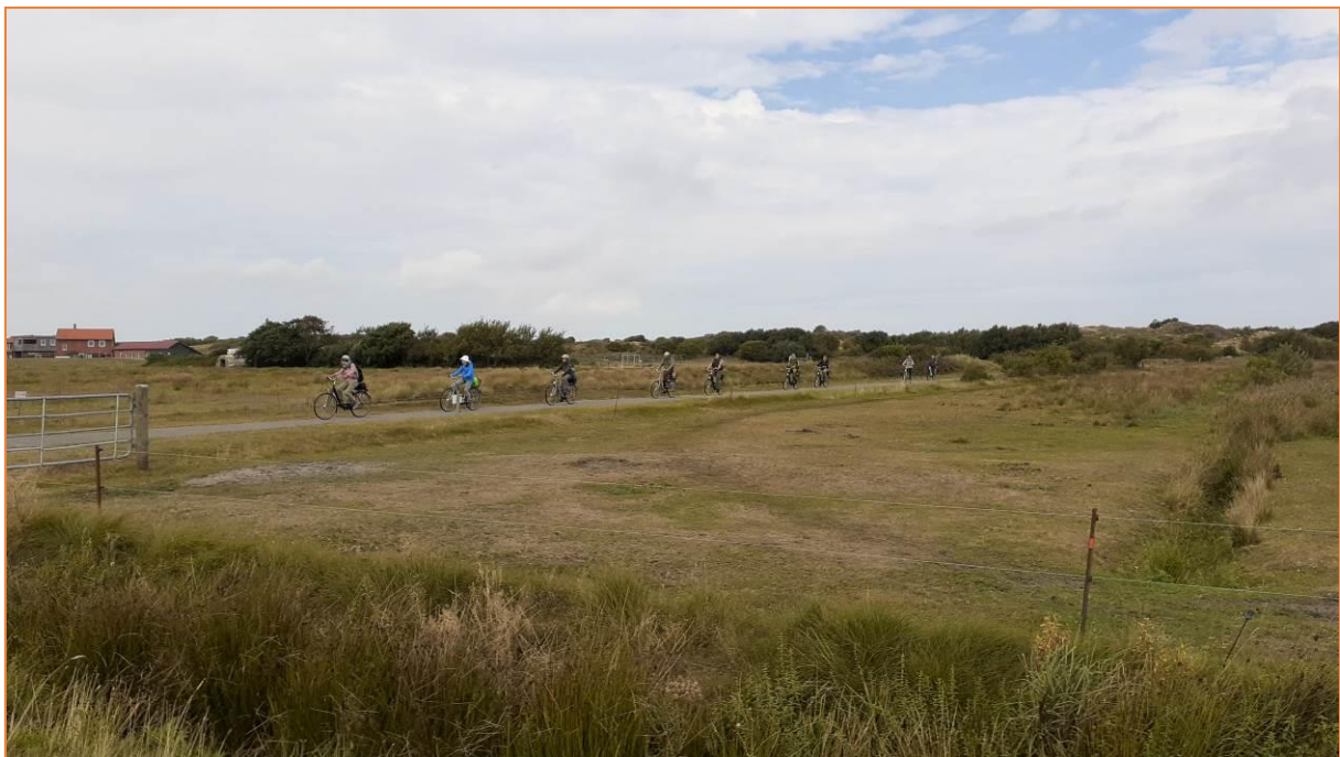
Mit dem Rad in Richtung Osterhook