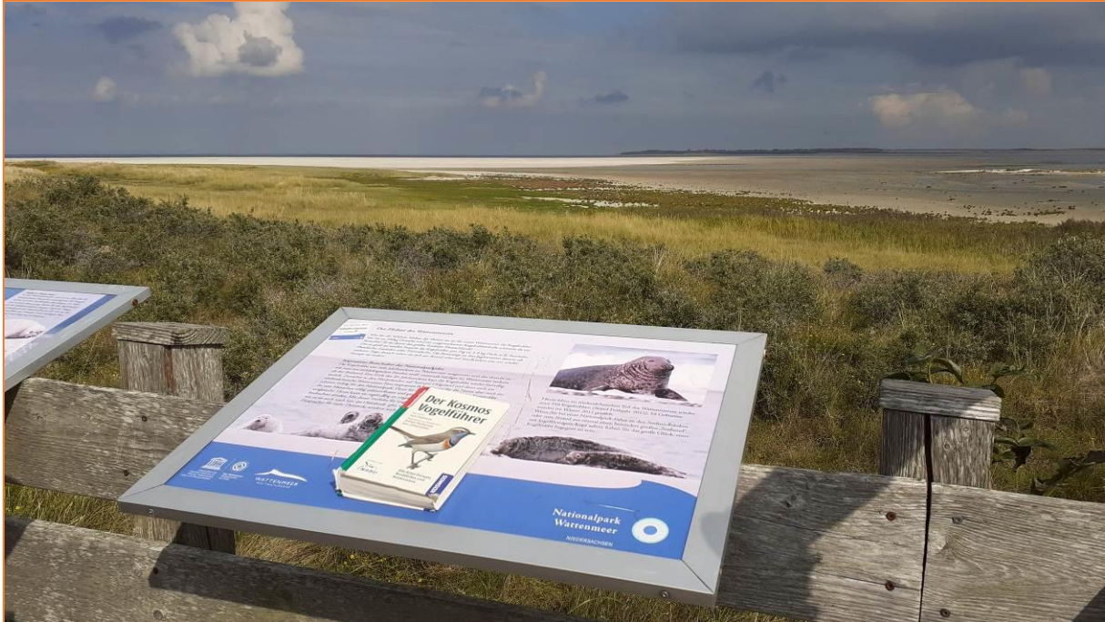
Am Osterhook mit Blick in Richtung Spiekeroog

Anschließend, an weiten Salzwiesen vorbei, die von einer Rohrweihe niedrig überflogen werden, kommen wir bei optimalem Tidenstand am Osterhook an.