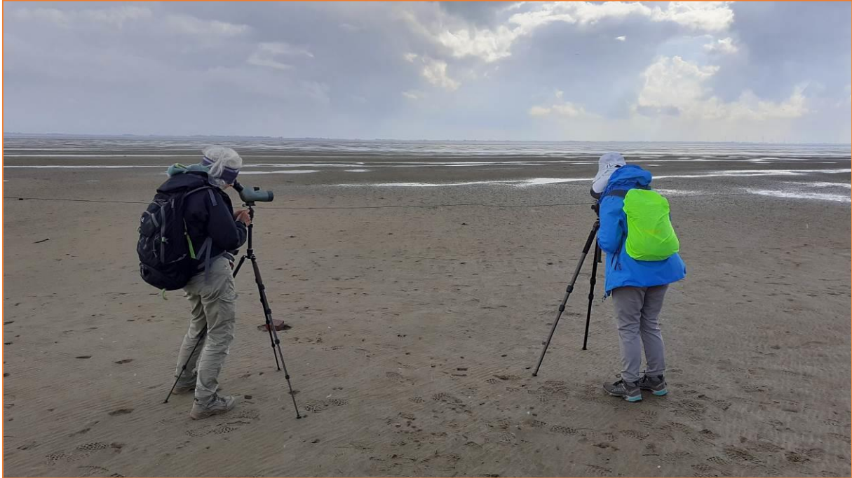
Vogelkiek am Wattenmeer