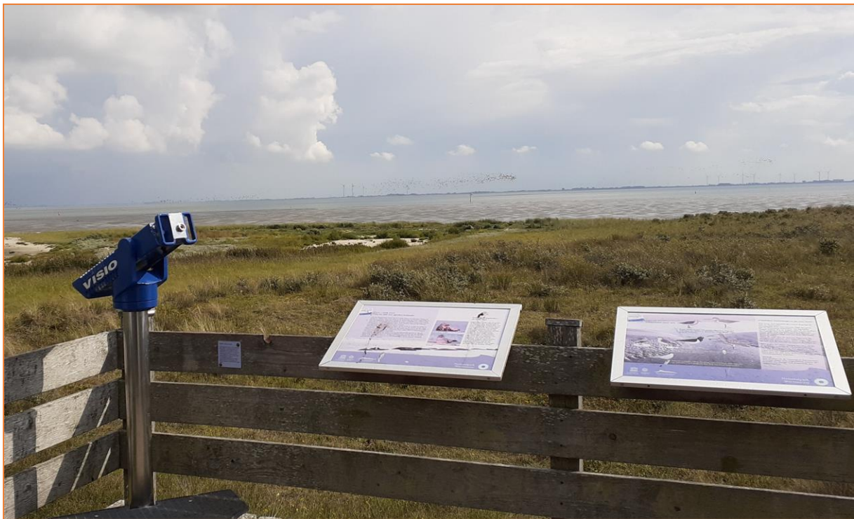
Blick von der Aussichtsplattform Osterhook in Richtung Spiekeroog

Die Insel Langeoog liegt inmitten des Wattenmeeres, einem der weltweit wichtigsten Rastplätze für den Vogelzug. Umrahmt von kulinarischen Genüssen besuchten wir die besten Beobachtungspunkte auf der autofreien Nordseeinsel.