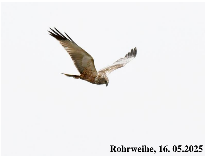
Rohrweihe, 16. 05.2025

Nach einem Spaziergang durch die blühende Buschlandschaft beim Melkhörn und einem kleinem Strandspaziergang folgte der anspruchsvollste Teil der Reise - das Erklimmen eines der höchsten Berge der ganzen Ostfriesischen Dünenkette, den dräuenden Gipfel der über 20 Meter hohe Melkhörndüne!