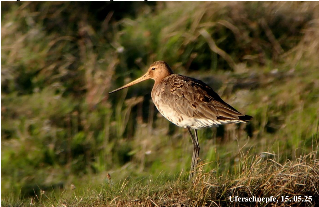
Uferschnepfe, 15. 05.25

Auch Kiebitz- und Uferschnepfenfamilien konnten wir im feinsten Abendlicht sehen, Austernfischer auf dem Nest zwische Strandgrasnelken (irgendwie doch romantischer als auf einem Flachdach...), Löffler, Ringelgänse und den rasenden Dorfsherif auf seinem Elektrofahrrad. Der hätte uns fast umgefahren, wie er da so - mit für diese Idylle völlig überhöhter Geschwindigkeit - angebrettert kam...