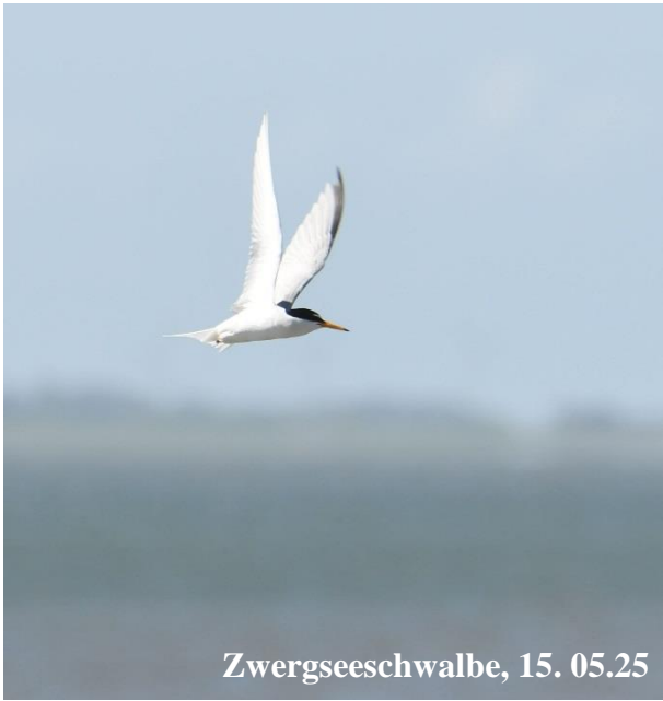
Zwergseeschwalbe, 15. 05.25