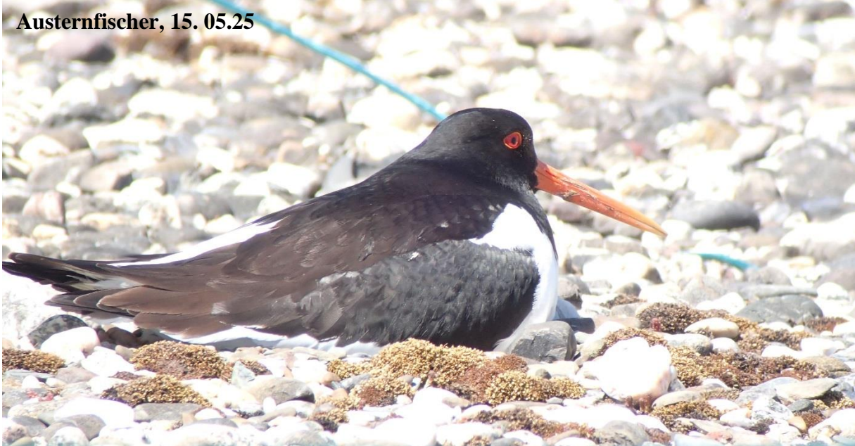
Austernfischer, 15. 05.25

Als nächstes stand der Spaziergang auf dem Flinthörnlehrpfad auf dem Programm. Ein Schwarzkehlchen ließ sich optimal beobachten, über den weiten Salzwiesen und Schilfflächen jaggte ein extravagant kontrastreiches Rohrweihenmännchen, und haufenweise Hänflinge tummelten sich in der Buschlandschaft. Beim Rückweg am Strand entlang konnten wir zwischen Sandregenpfeifern und Alpisen auch erste Sanderlinge entdecken.