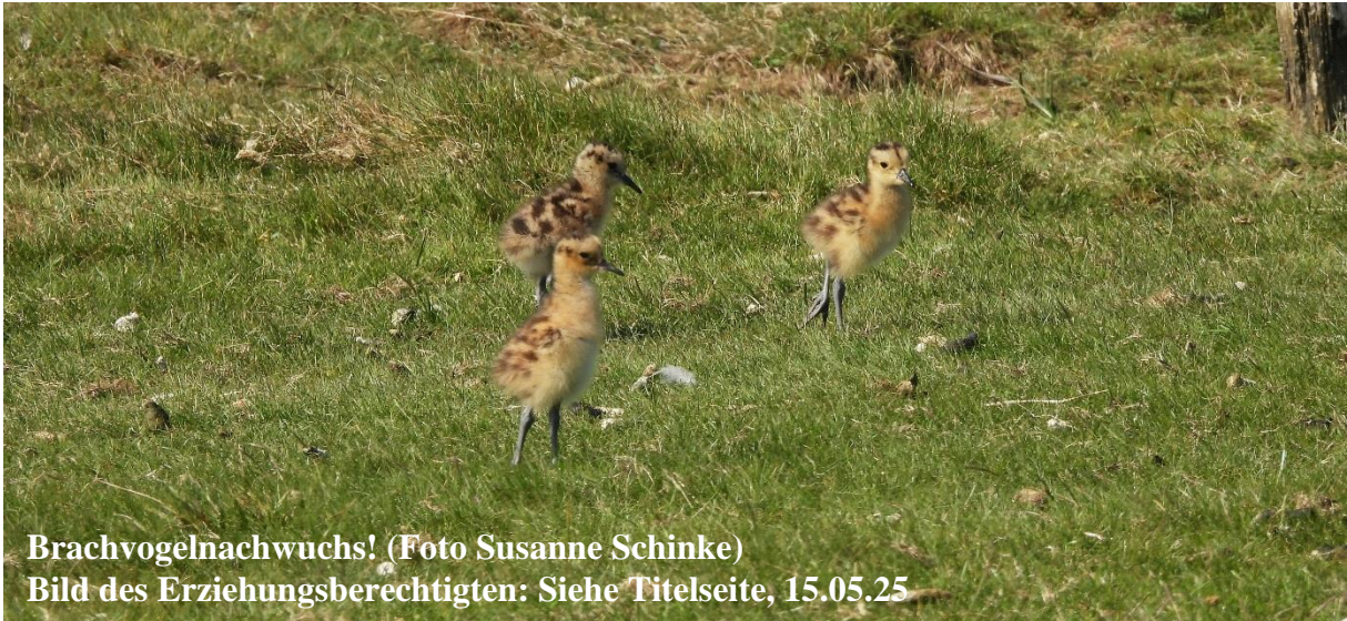
Brachvogelnachwuchs! Bild des Erziehungsberechtigten: Siehe Titelseite, 15.05.25

Nach dem Abendessen machten wir noch einen Ausflug mit dem Spezialauftrag die Sumpfohreule zu entdecken. Die wollte sich zwar leider nicht zeigen, dafür bekamen wir ein Erlebnis geboten, das auch auf Langeoog selten ist: Direkt am Weg eine Brachvogelfamilie mit drei Küken!