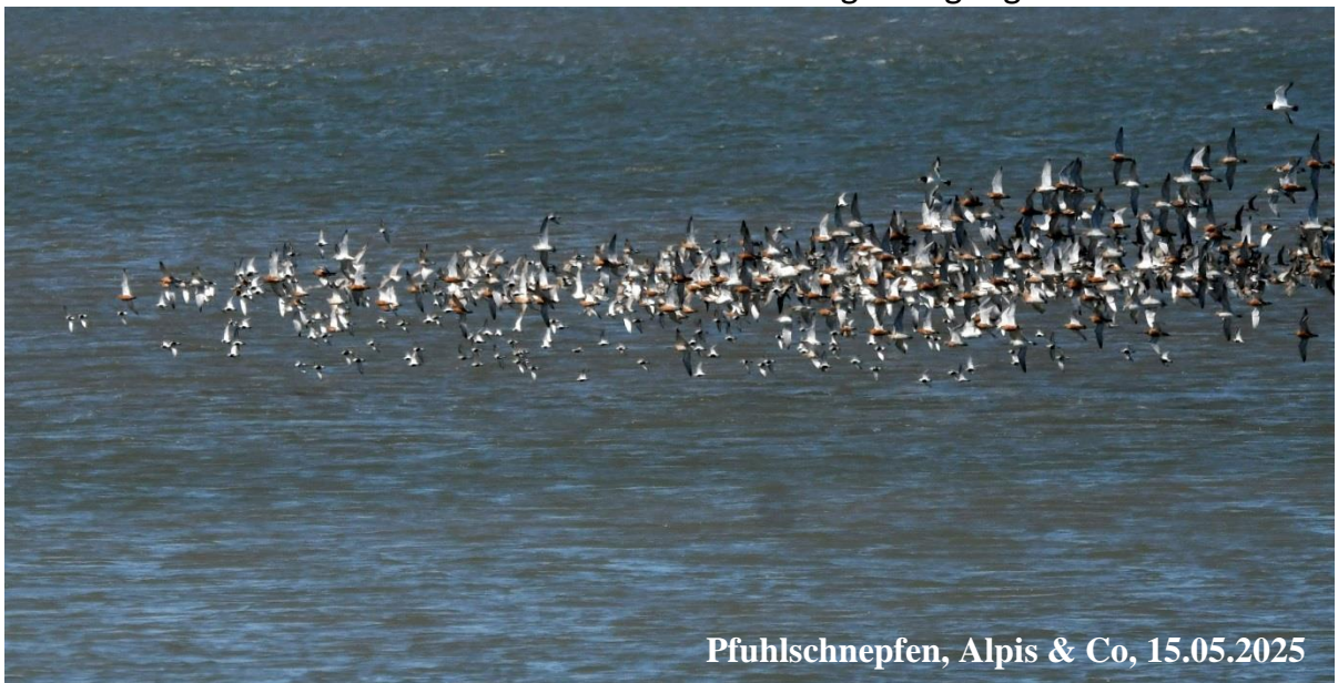
Pfuhschnepfen, Alpis & Co, 15.05.2025

Genau zur perfekten Tide kamen wir am Flinthörn watt an, wo Pfuhschnepfen, Alpenstrandläufer & Co ihren ersten großen Auftritt hatten. Die großen Schwärme wissen immer wieder mit ihren rasend schnellen Flugbewegungen zu beeindrucken!