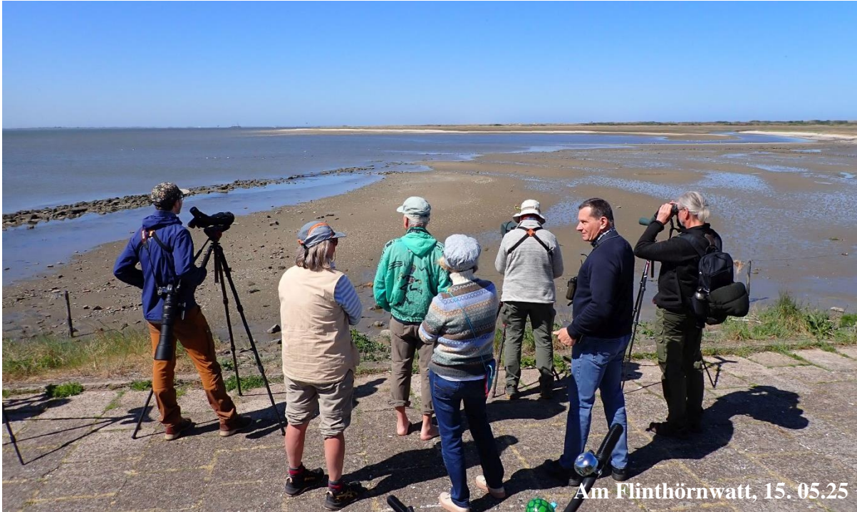
Am Flinthörn watt, 15. 05.25

Vor Ort waren auch Steinwälzer, Regenbrachvögel, Eiderenten, richtig viele Sandregenpfeifer und als großes Highlight ein kleiner Merlin, überfliegend. Sehr viel Freude haben die direkt vor uns jagenden Seeschwalben verbreitet, vier Arten waren mit von der Partie: Brand-, Zwerg-, Fluss- und Küsten-seeschwalben. Letztere die Lebewesen mit dem weitesten Zugweg des Planeten, von Langeoog bis an Antarktische Küsten, zuweilen sogar bis Neuseeland!