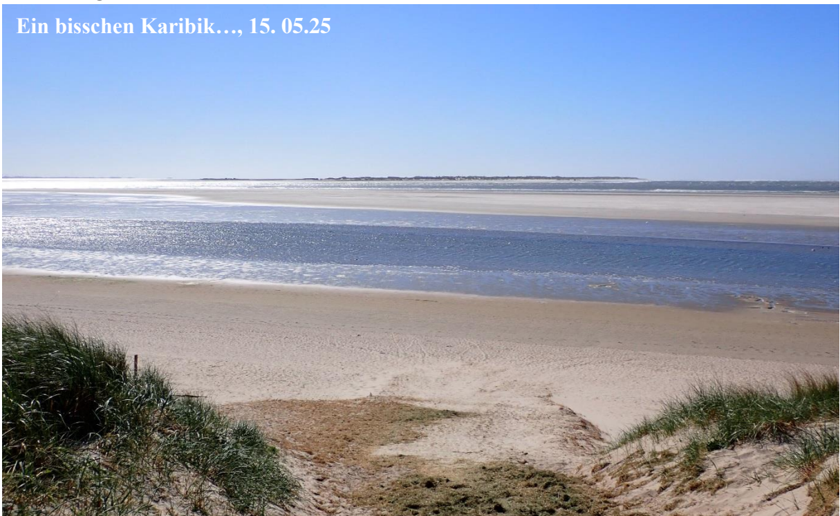
Ein bisschen Karibik..., 15. 05.25

Als nächstes stand der Spaziergang auf dem Flinthörnlehrpfad auf dem Programm. Ein Schwarzkehlchen ließ sich optimal beobachten, über den weiten Salzwiesen und Schilfflächen jaggte ein extravagant kontrastreiches Rohrweihenmännchen, und haufenweise Hänflinge tummelten sich in der Buschlandschaft. Beim Rückweg am Strand entlang konnten wir zwischen Sandregenpfeifern und Alpisen auch erste Sanderlinge entdecken.