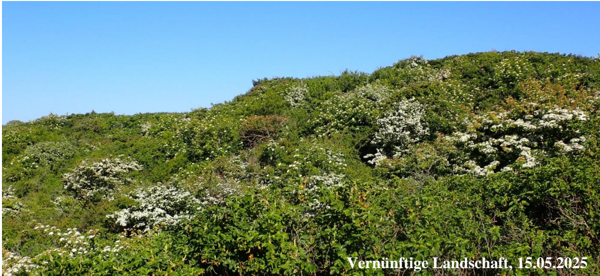
Vernünftige Landschaft, 15.05.2025

Das mit blühendem Weißdorn und Hollunder weiß getupfte Buschland der Randdünen saß voll offensichtlich gut gelaunter, lauthals singender Singvögel, unter anderem Fitisse, Heckenbraunellen und gleich vier Grasmückenarten: Dorn-, Klapper-, Garten- und Mönchsgrasmücke wetteiferten um die Aufmerksamkeit unserer Reisegruppe.