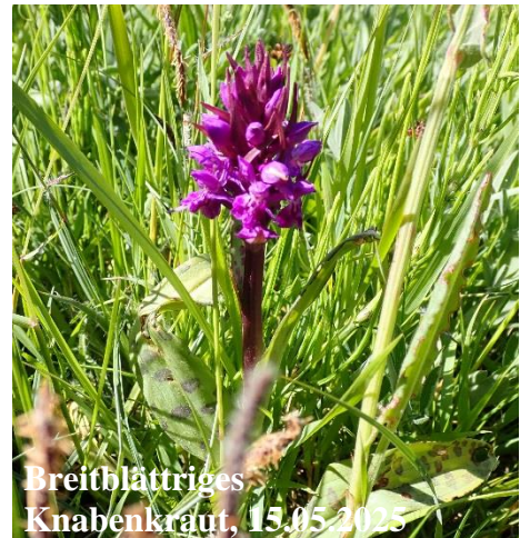
Breitblättriges Knabenkraut, 15.05.2025

Sodann fuhren wir durch den wilden Inselwald (wo sich u. A. ein Grauschnäpper hören ließ) zu den Orchideenwiesen. Hier grasten noch eine Menge hungriger Nonnengänse, kurz vorm Abflug gen Brutgebiet in Westsibirien. Zum Glück verschmähen sie offenbar das Breitblättrige Knabenkraut, welches zwischen den gelben Klappertopf- und den weißen Gänseblümchenrasen gerade überall lila zu blühen beginnt. Auch zwei Ringelgänse, die sogar noch zur 5000 Kilometer entfernten Taimyrhalbinsel reisen müssen, waren dabei.