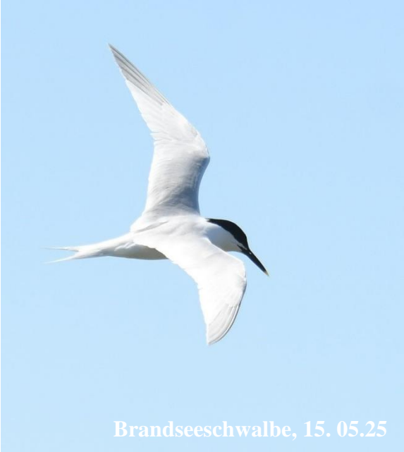
Brandseeschwalbe, 15. 05.25