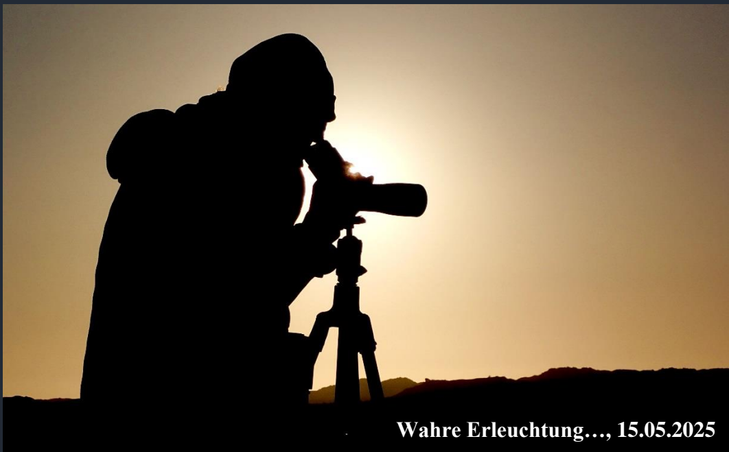
Wahre Erleuchtung..., 15.05.2025