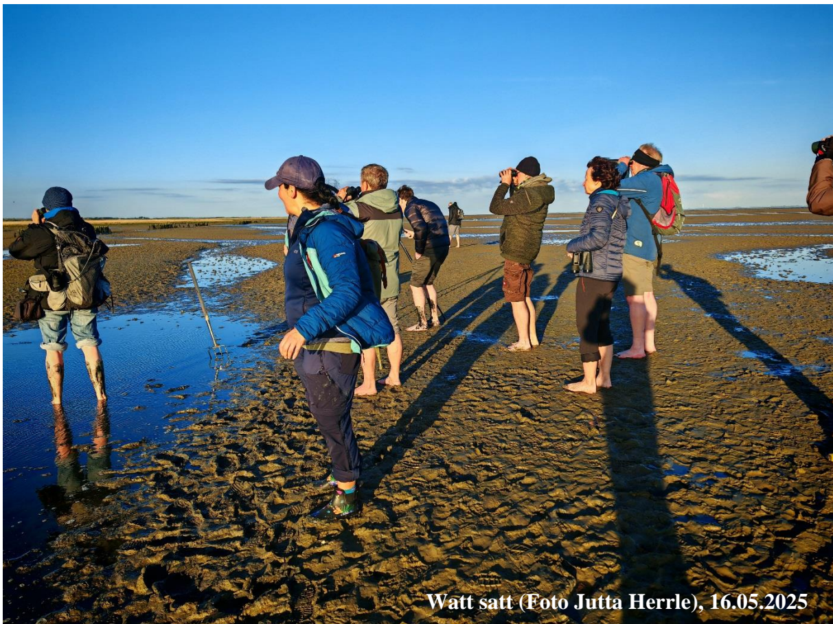
Watt satt, 16.05.2025