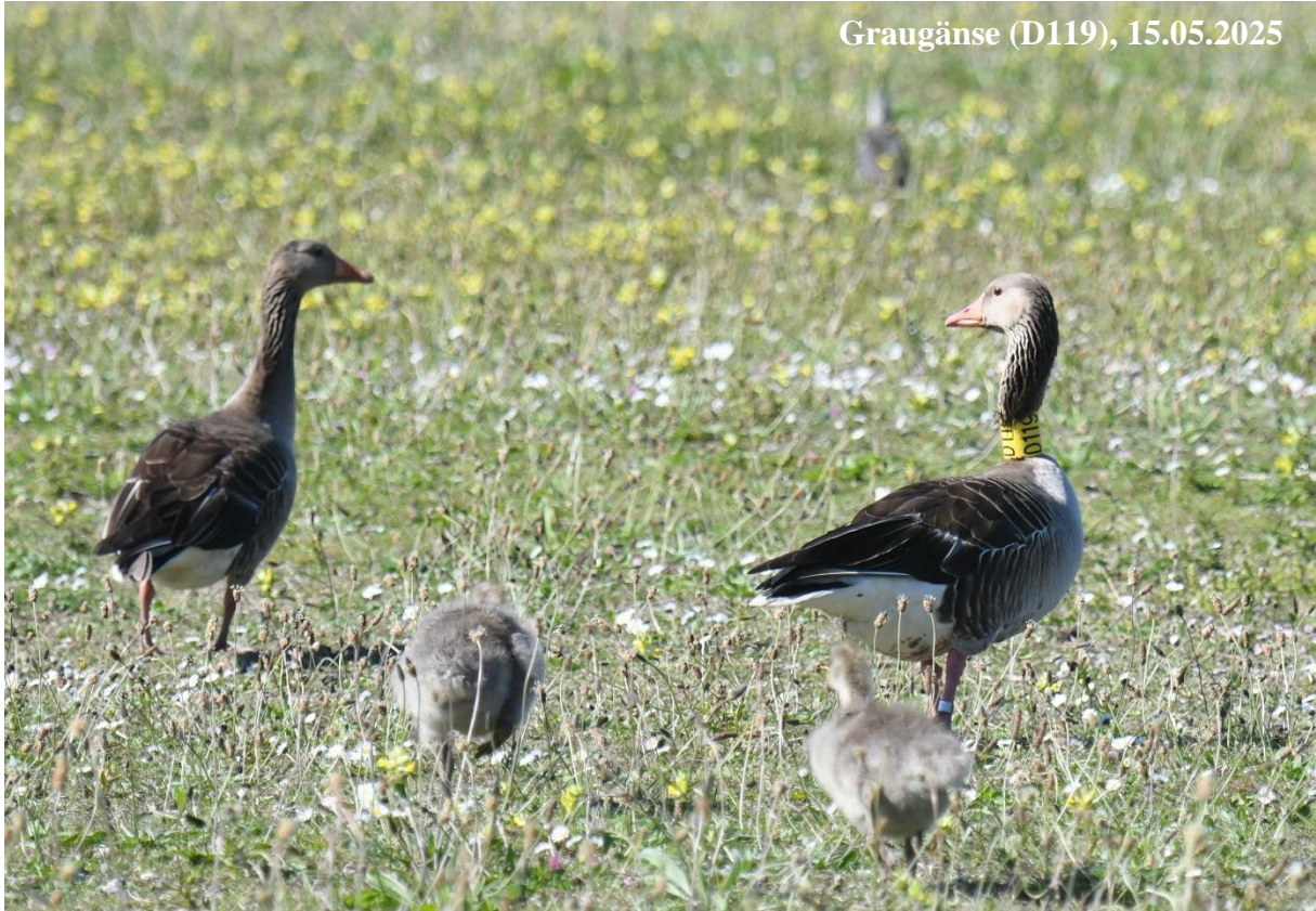
Graugänse (D119), 15.05.2025

Bei einer Graugansfamilie mit zwei Küken war der Papa beringt. Die Rückmeldung ergab, dass er über 8 Jahre alt und in seinem Leben innerhalb Ostfrieslands reichlich rumgekommen ist – von Aurich über Norderney bis Emden. Immer wieder wurde er auch auf Langeoog gemeldet.