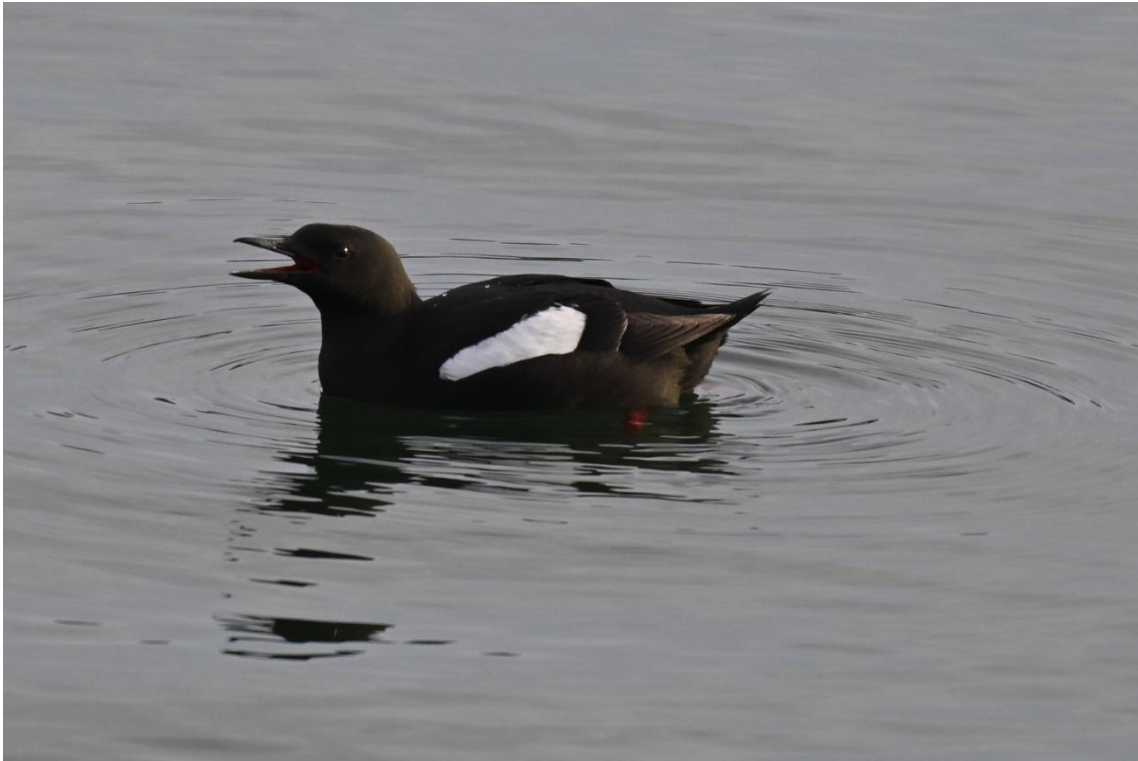
Gryllsteiste, Helgoland 29.05.26 (Julian Treffler)

Schwalben die in Deutschland nur sehr selten zu beobachtenden Rötelschwalbe, ebenfalls aus Südeuropa stammend. Auf dem Rückweg zum Frühstück singt der Iberienzilpzalp. Sind wir tatsächlich noch auf Helgoland oder auf einer Insel im Mittelmeer? Das Frühstück schmeckt an diesem Tag besonders gut.