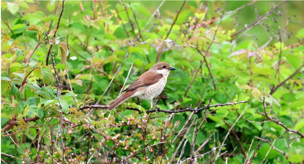
Neuntöter Weibchen (Micha A. Neumann)

Ein sehr spannende und schöne Helgolandreise geht zu Ende.