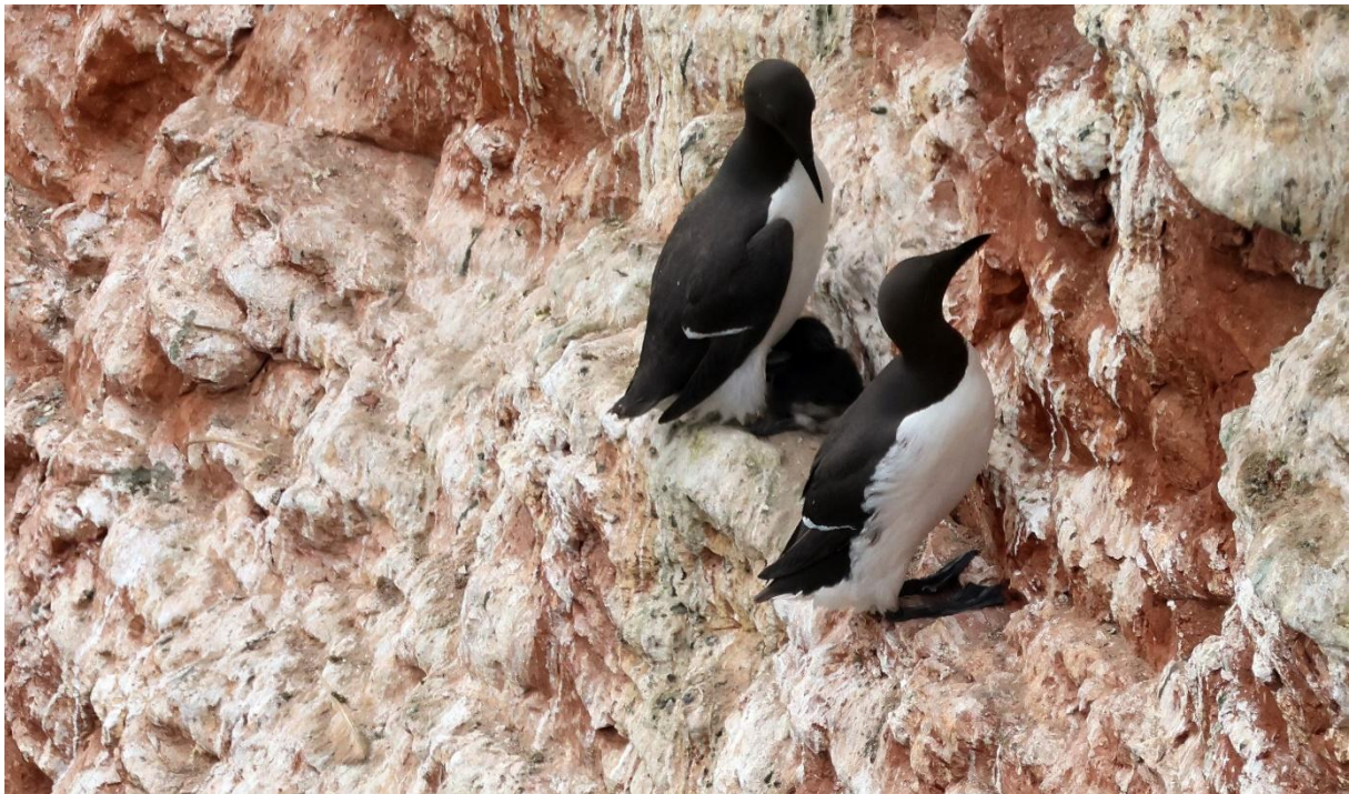
Trottellummen mit Jungvogel (Micha A. Neumann)

Als Gruppe zieht es uns nach dem Frühstück wieder zum Vogelfelsen. So viel gibt es dort noch zu suchen und zu entdecken. Wo verstecken die Trottellummen bloß ihre Küken? Mit Ausdauer und Glück entdecken wir ein paar Eier und Jungtiere, aber die Eltern sind sehr vorsichtig und achtsam, bei all den „Räubern“ wie Krähen und Großmöwen in der Nähe.