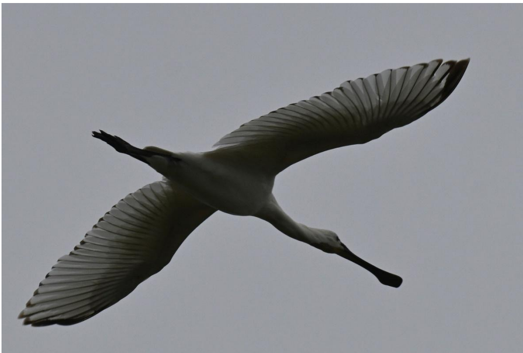
Löffler über Helgoland (Julian Treffler)

Weibliche Neuntöter sind an dem blasserem rotbraunen Rücken, der weniger deutlichen Maske und den wellenförmigen Streifen auf Brust und Bauch vom Männchen zu unterscheiden.