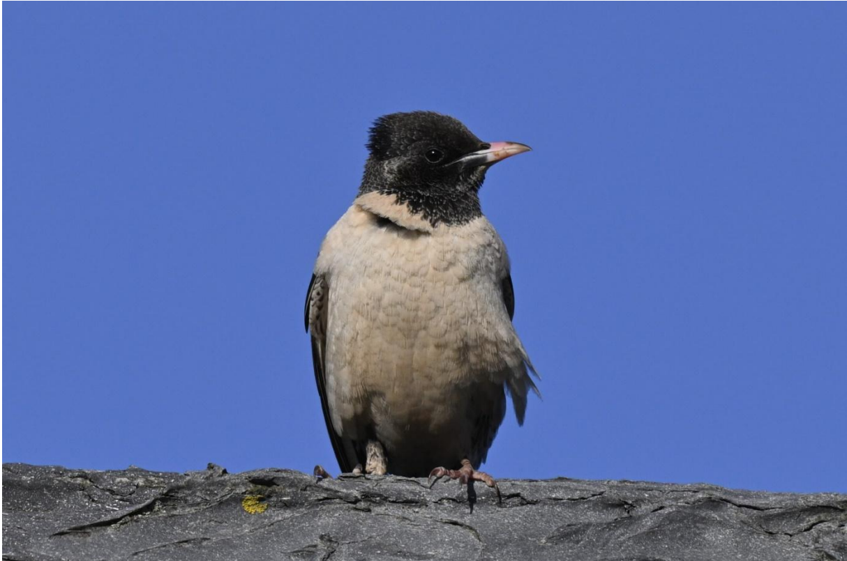
Rosenstar auf Helgoland am 27.05.26 (Julian Treffler)