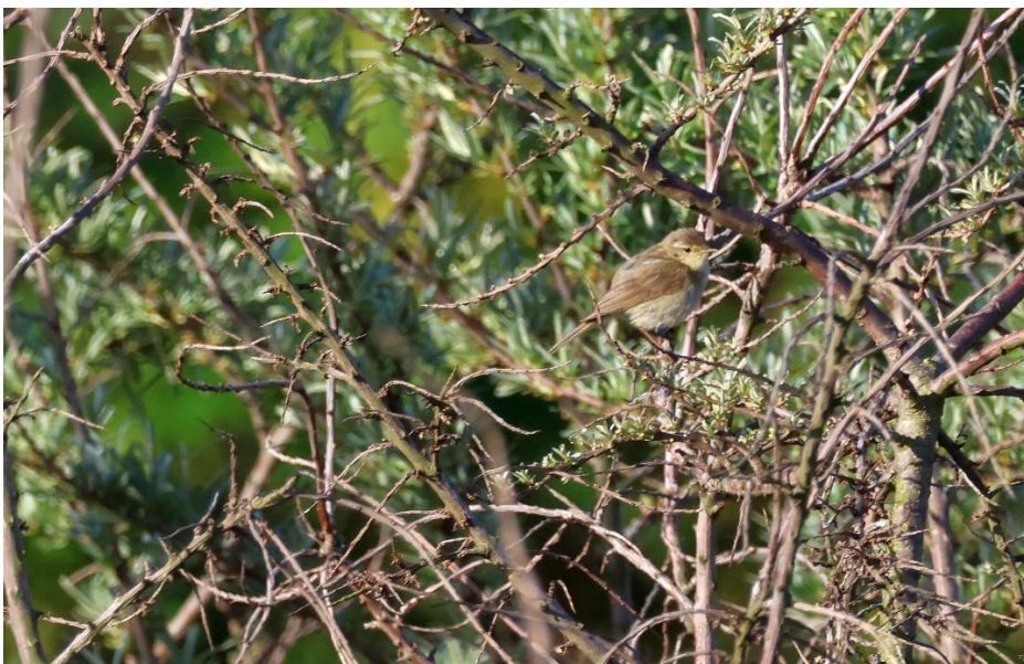
Iberienzilpzalp, Helgoland 28.05.26 (M.A. Neumann)

Bei der Frühexkursion wird ein Karmingimpel gehört, ein singendes Sommergoldhähnchen und ein rastender Fichtenkreuzschnabel. Noch seltener ist der Iberienzilpzalp, der an der Ostklippe gut zu beobachten ist. Sein Gesang, eine kurze Strophe mit einem eingebauten Triller, unterscheidet ihn vom normalen Zilpzalp. Optisch ist der Iberienzilpzalp nur schwer vom Zilpzalp zu unterscheiden. Insgesamt ist er etwas grünlicher, hat hellere Beine und einen deutlicheren Überaugenstreif als sein mitteleuropäischer Verwandter.