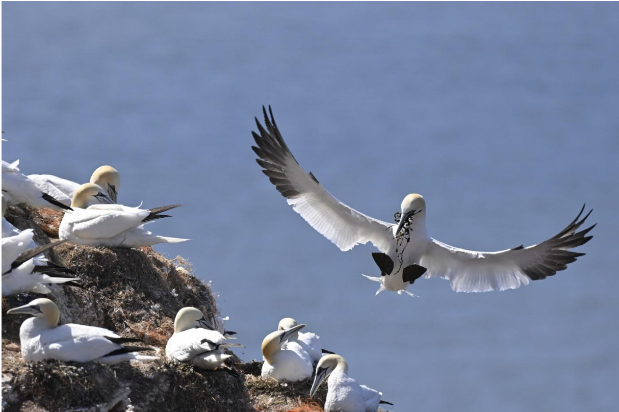
Basstölpel im Anflug mit Nistmaterial (Julian Treffler)