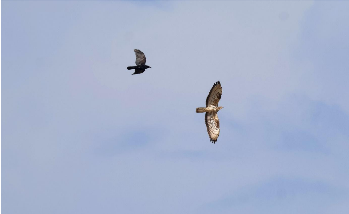
Wespenbussard, von Krähe attackiert (M.A. Neumann) Charakteristisch ist die im Vergleich zum Mäusebussard schlankere Gestalt, der kleine taubenähnliche Kopf und die feine Strichelung auf dem Unterflügel.