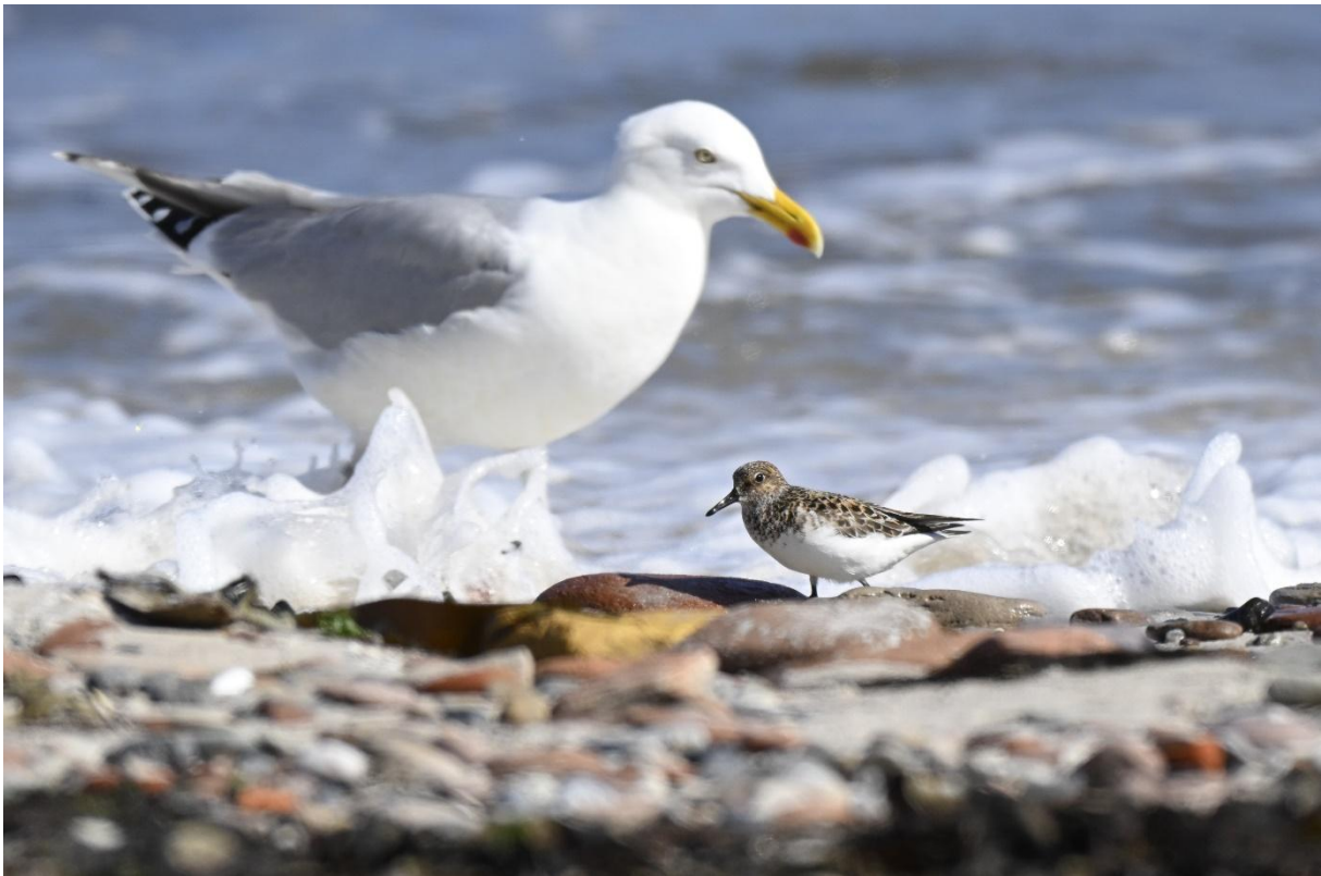
Sanderling vor Silbermöwe (Julian Treffler)

Erwähnenswert ist auch die Sichtung verschiedener Schafstelzenunterarten nebeneinander. So können wir Wiesen-, Thunberg- und Gelbkopfschafstelze beobachten.