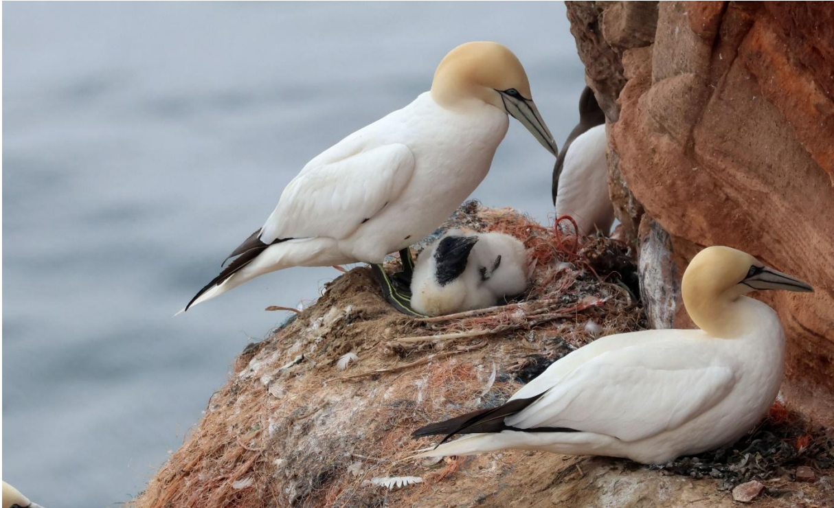
Basstölpel mit Jungvogel (Micha A. Neumann)

Nach der Mittagspause fahren wir erneut auf die Düne. Am Vormittag wurde dort die in Deutschland sehr seltene südosteuropäische Kappenammer entdeckt. Der anfangs unstete Vogel hat zwischenzeitlich ein festes Quartier in den Sanddornbüschen beim Flughafen gefunden. Dort können wir ihn aus einiger Entfernung auf Anhieb gut beobachten. Anschließend bleibt noch genügend Zeit, die Dünenteichen noch einmal aufzusuchen und am Strand Austernfischer, Sandregenpfeifer und Kegelrobben zu beobachten – heute zum Glück ohne Drama. Am frühen Abend gelingt es – zurück auf der Hauptinsel – einem der Teilnehmer die sehr heimliche Balkanbartgrasmücke zu fotografieren.