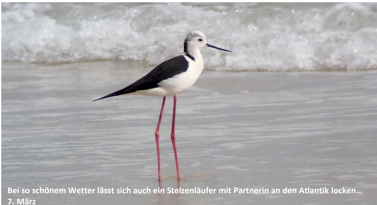
Bei so schönem Wetter lässt sich auch ein Stelzenläufer mit Partnerin an den Atlantik locken... 7. März

Trotz teils schwieriger Wetterbedingungen war es wieder eine fantastische Reise mit feinsten Beobachtungen! Allerbesten nochmals Dank an alle, muchas gracias!!!