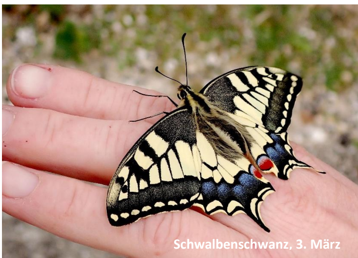
Schwalbenschwanz, 3. März