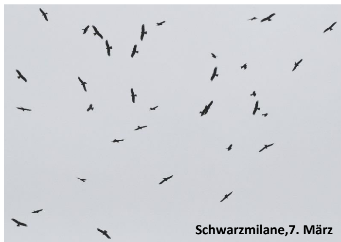
Schwarzmilane, 7. März