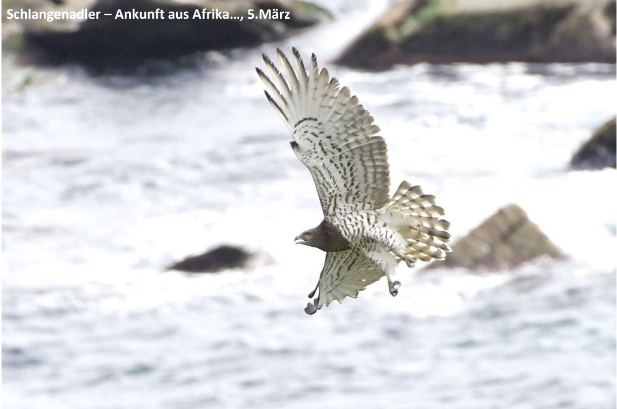
Schlangenadler – Ankunft aus Afrika..., 5.März

Dann mussten wir uns beeilen, nach Punta Carnero zu kommen, um mit Hilfe der besagten Regenglocke unser Vogelzugglück zu suchen. Tatsächlich waren wir endlich erfolgreich! Mehr als 100 Schlangenadler kamen innerhalb einer guten Stunde an - über uns; auf Augenhöhe und direkt unter uns am Kliff! Dazu auch viele Schwarzmilane und vereinzelt Zwergadler, so wie ein großer Schwarm Weißstörche. So muss das! Dazwischen jagten Basstölpel und Brandseeschwalben überm Wasser, eine Krähenschabe saß auf einem Felsen.