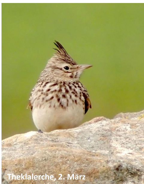
Theklalerche, 2. März