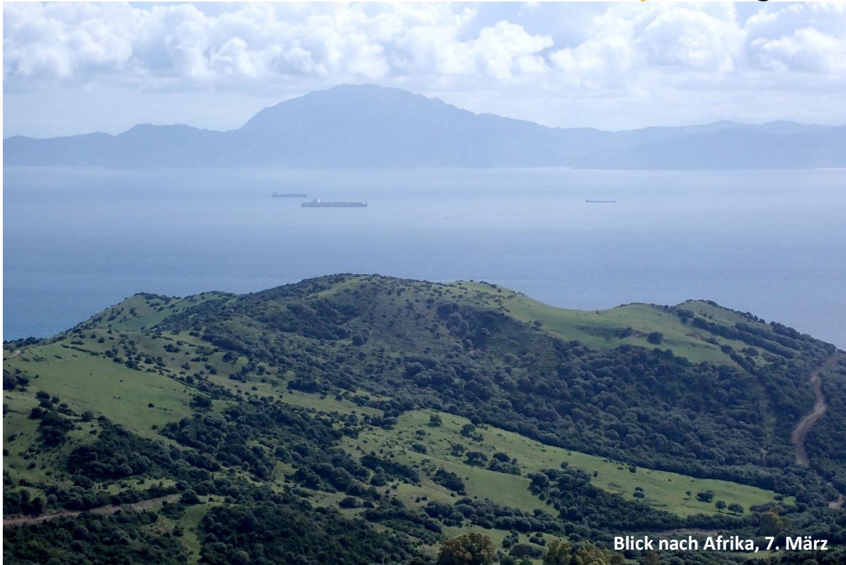
Blick nach Afrika, 7. März