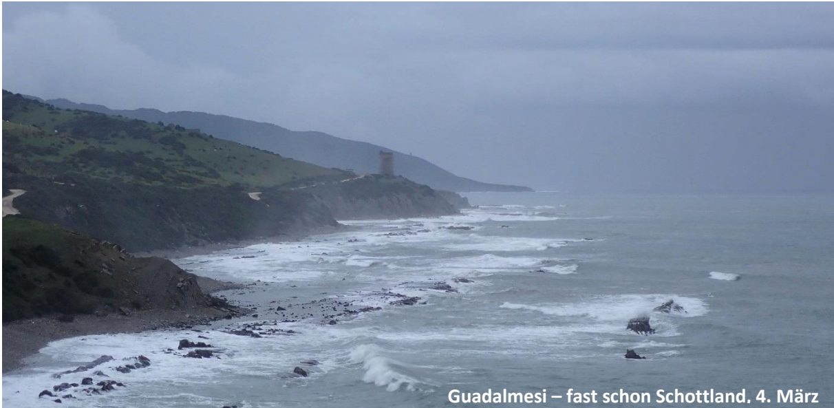
Guadalmesi – fast schon Schottland. 4. März

Das Wetter zeigte sich von schlechter Seite, so fuhren wir zunächst im Regen zur Ausstellung von Cazalla. In der Hoffnung auf eine Zugstauauflösung ging es dann die abenteuerliche Bergstraße runter an die Kliffs bei Guadalmesi, wo man sich fast eher in Schottland wühlt als in Spanien. Besonders bei dem Wetter.