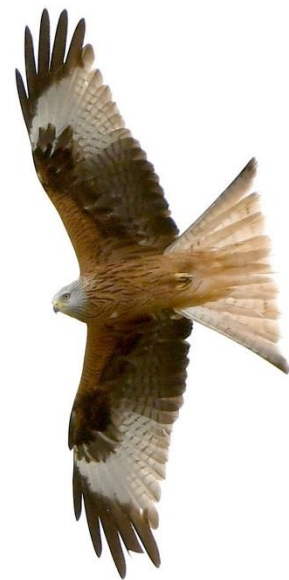
Rotmilan, 3. März

Der erhoffte Gleitaar und der Iberienadler ließen uns zwar im Stich, dafür hatten einige das große Glück, die seltenen Häherkuckucke aus nächster Nähe zu entdecken! Klasse waren auch die vielen Rohrweihen, eine Kornweihe und – hier recht selten - ein Rotmilan, an dem man gut die Unterschiede zu den vielen Schwarzmilanen studieren konnte.