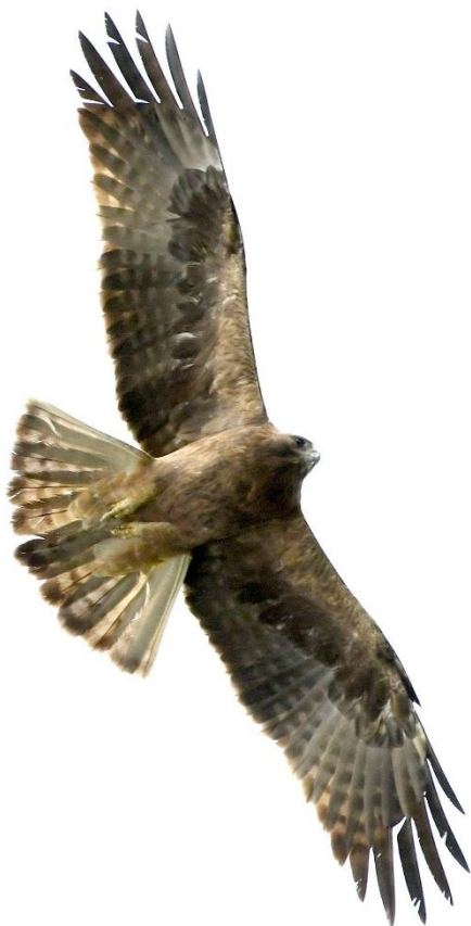
Zwergadler, dunkle Form, 7. März

Als der Strom der ankommenden Greifvögel dann doch abebbte, fuhren wir zum Mirador del Estrecho um die Erlebnisse bei einer Tasse Kaffee zu verarbeiten. Aber hier ging es gleich weiter: Die Gänsegeier flogen spektakulär nahe vorbei und ein riesiger Schwarm gerade angekommener Schwarzmilane kreiste über uns. Entfernt vor einem Berghang ließ sich mehrfach ein Habichtsadler sehen, führte wilde Balzflüge vor und landete sogar zweimal in einem Baum.