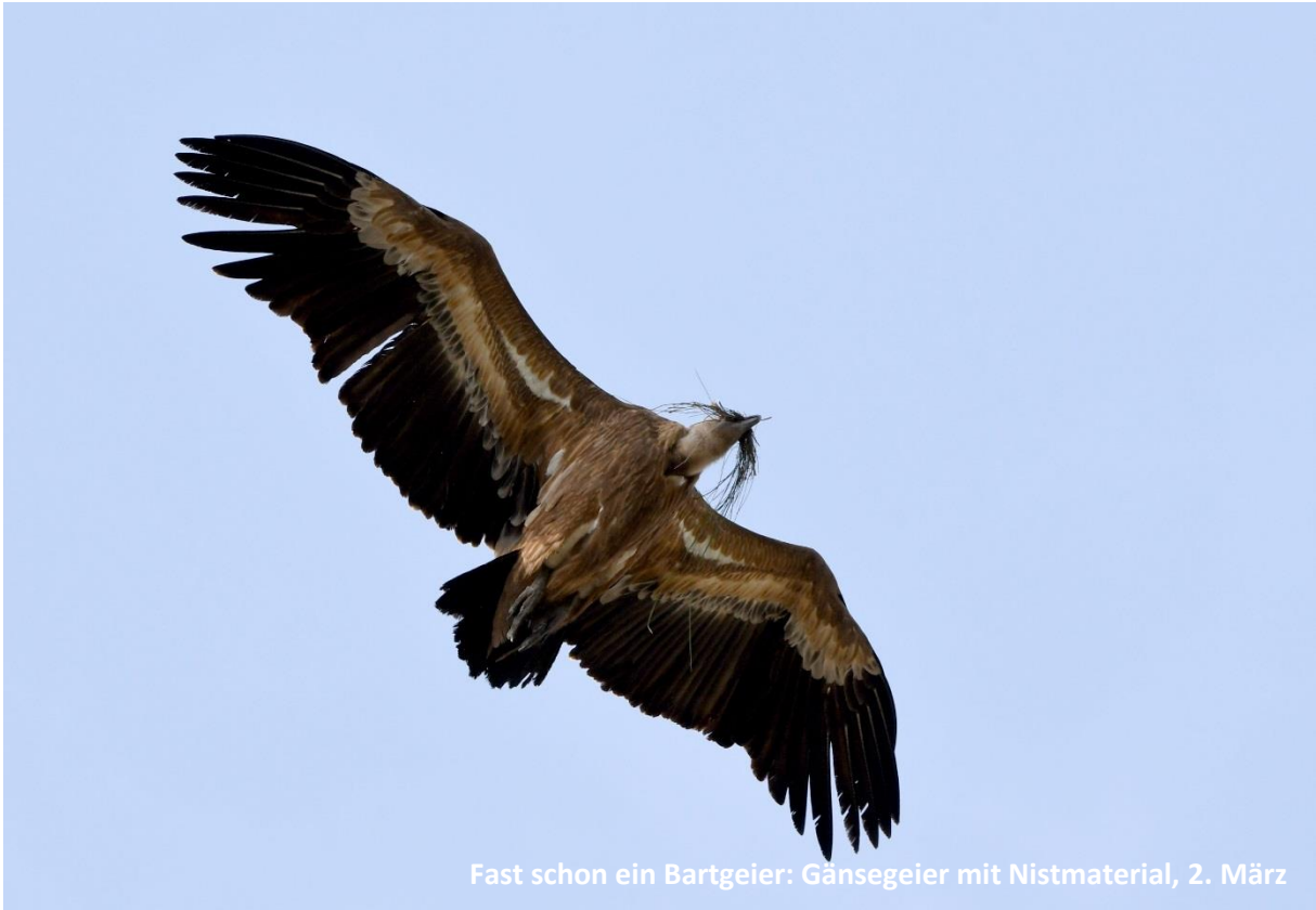
Fast schon ein Bartgeier: Gänsegeier mit Nistmaterial, 2. März