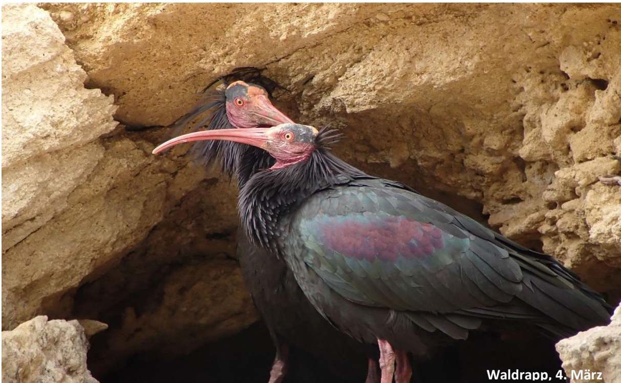
Waldrapp, 4. März

Diese seltsamen Wesen sind bei jedem Wetter faszinierend, ihrem fast menschlich anmutenden Verhalten könnte man stundenlang zusehen, besonders jetzt zur Balz- und Nestbauzeit.