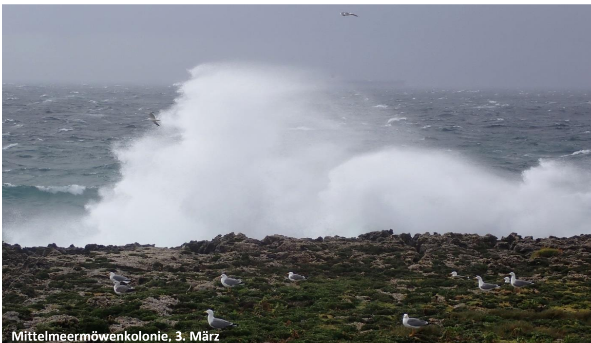
Mittelmeermöwenkolonie, 3. März