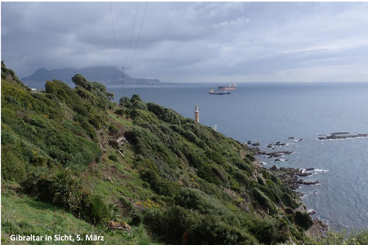
Gibraltar in Sicht, 5. März