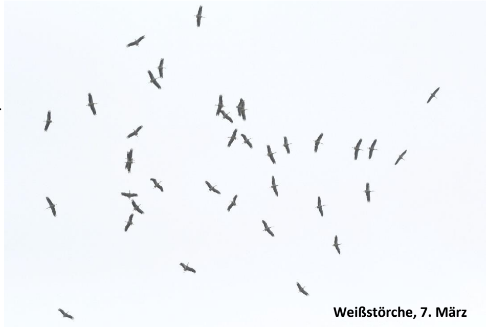
Weißstörche, 7. März