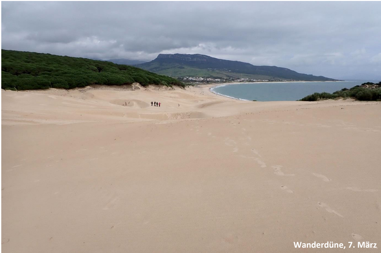
Wanderdüne, 7. März

Als zünftigen Abschluss für die Reise genossen wir dann einen gemütlichen Spaziergang den Schirmkiefernwald hinauf, auf die riesige Wanderdüne von Bolonia.