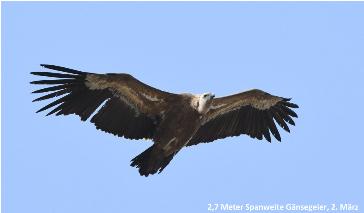
2,7 Meter Spannweite Gänsegeier, 2. März

Nach einer Pause in einem sehr kleinen, sehr traditionellen und sehr netten Café mit sehr schöner Aussicht fuhren wir zum Geierfelsen. Hier flogen die riesigen Vögel in geringer Distanz von und zu ihren Nestern in der Felswand und brachten Nistmaterial.