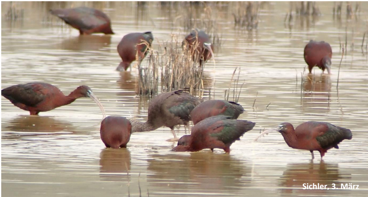
Sichler, 3. März

Dazu jede Menge der schön glänzenden Sichler, Kuh- und Seidenreiher, Störche, Löffler, ein schönes Rothuhnpaar, Flussregenpfeifer, Waldwasserwassertläufer, etc. – und als echte Besonderheit ließen sich sogar einige der seltsamen Purpurhühner blicken.