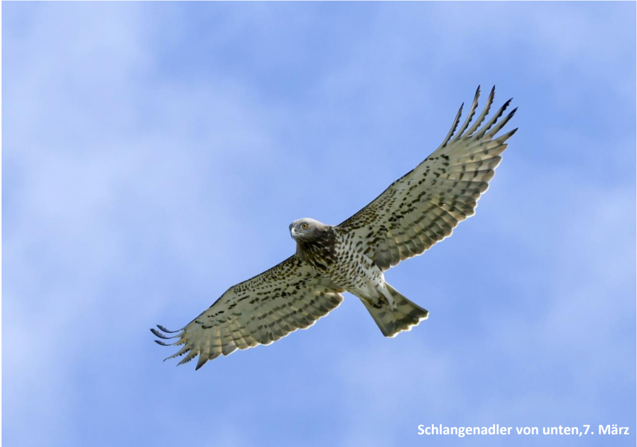
Schlangenadler von unten, 7. März