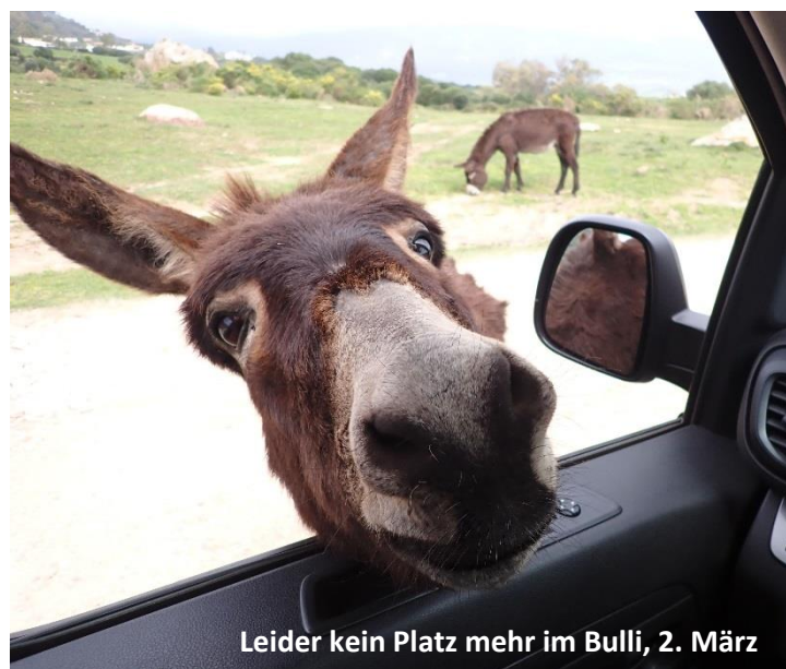
Leider kein Platz mehr im Bulli, 2. März