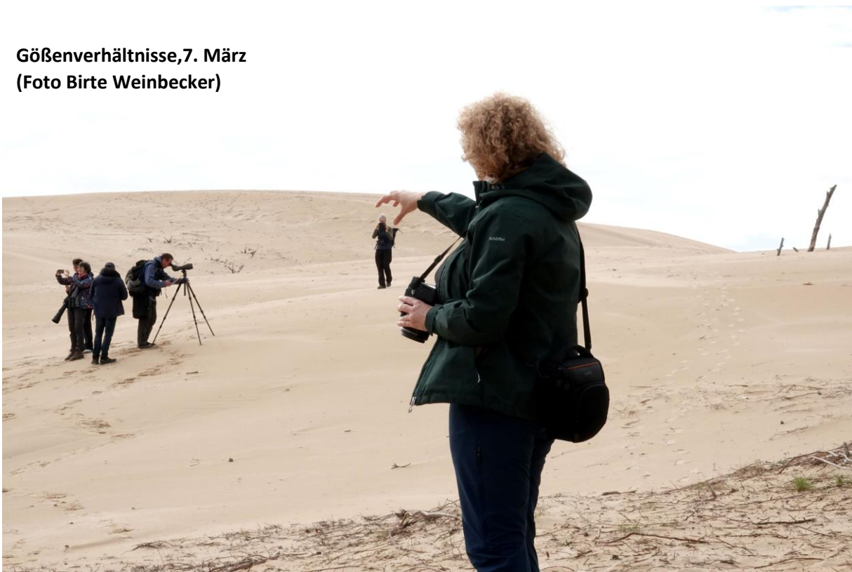
Gößenverhältnisse, 7. März