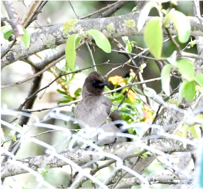
Der einzige Graubülbül Europas, 5.März

Austeigen, um ihn nicht zu verjagen, so dass nicht alle den illustren Irrgast aus Afrika sehen konnten.