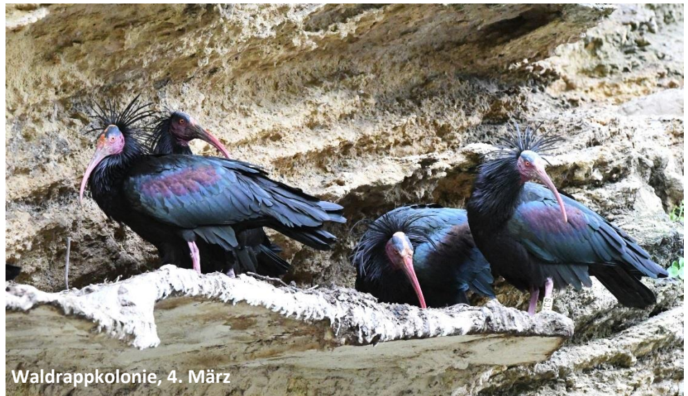
Waldrappkolonie, 4. März