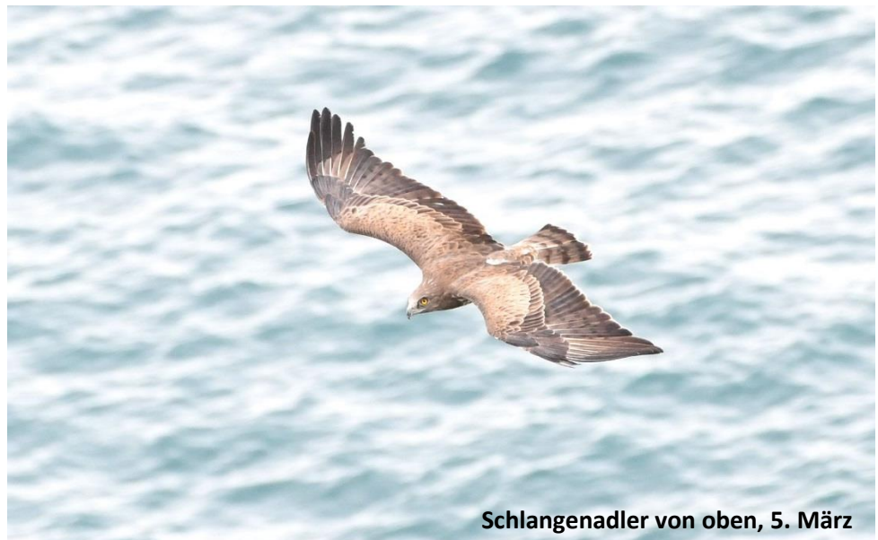
Schlangenadler von oben, 5. März