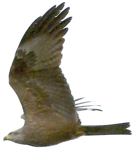
Schwarzmilan, 7. März

Als der Strom der ankommenden Greifvögel dann doch abebbte, fuhren wir zum Mirador del Estrecho um die Erlebnisse bei einer Tasse Kaffee zu verarbeiten. Aber hier ging es gleich weiter: Die Gänsegeier flogen spektakulär nahe vorbei und ein riesiger Schwarm gerade angekommener Schwarzmilane kreiste über uns. Entfernt vor einem Berghang ließ sich mehrfach ein Habichtsadler sehen, führte wilde Balzflüge vor und landete sogar zweimal in einem Baum.