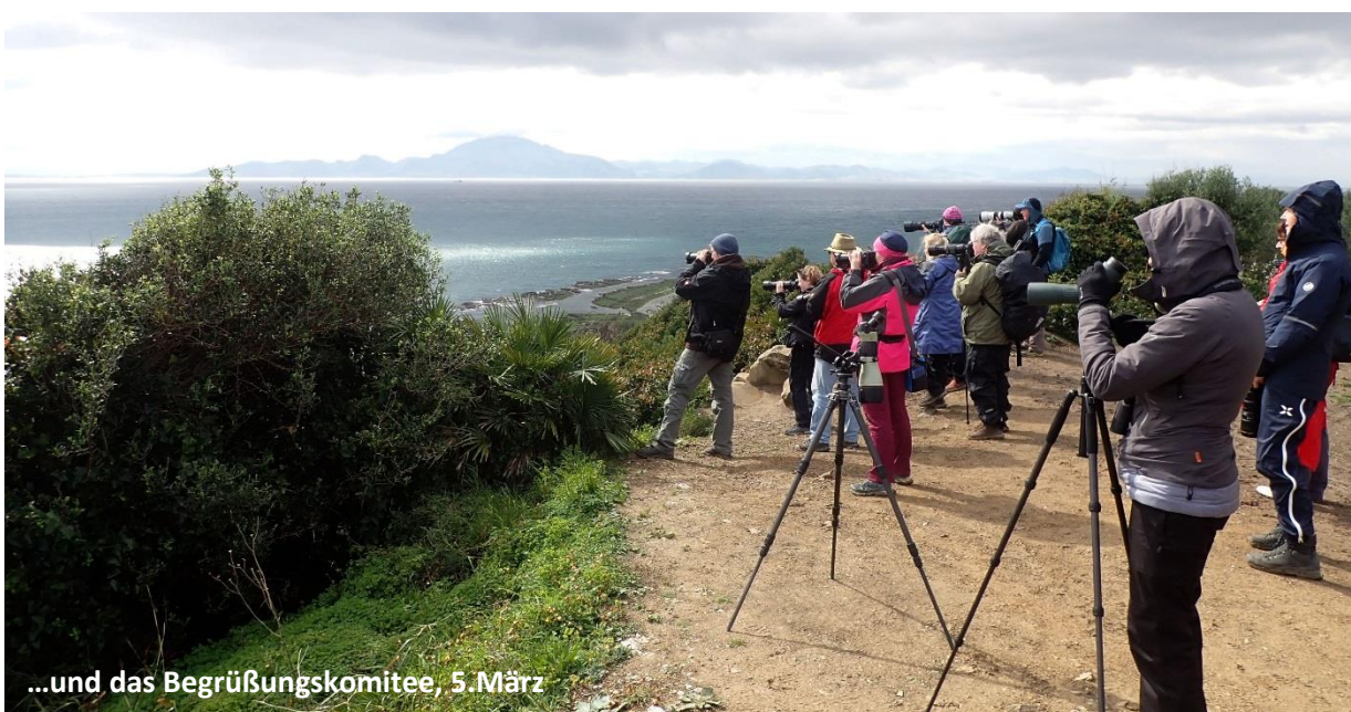
...und das Begrüßungskomitee, 5.März