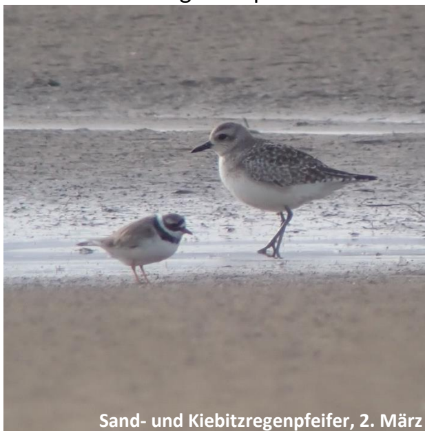
Sand- und Kiebitzregenpfeifer, 2. März

Unser erster Programmpunkt war der Spaziergang zur Beobachtungshütte am