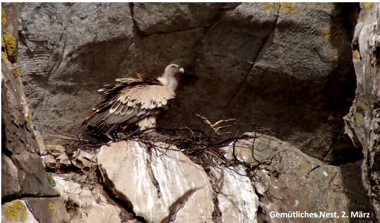
Gemütliches Nest, 2. März