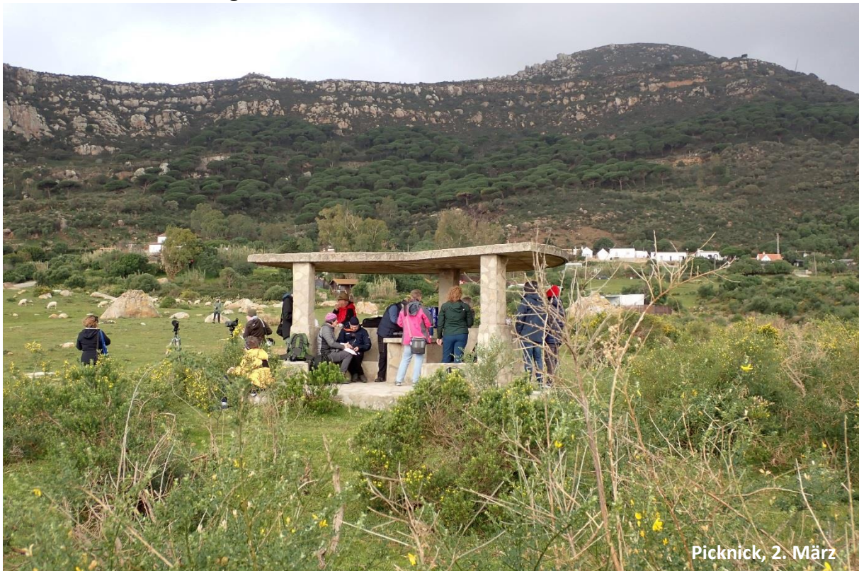
Picknick, 2. März

Nach ausgiebiger Proviantierung ging es zum nächsten Beobachtungsort, dem schönen Valle Santuario. Bei einem Picknick kamen nicht nur viele sehr interessante Vögel wie Thekla- und Haubenlerchen vorbei, sondern auch viele sehr interessierte Ziegen, Esel, Pferde, Schafe und Kühe.