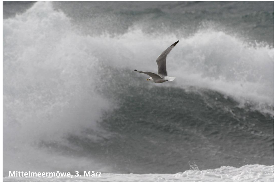
Mittelmeermöwe, 3. März