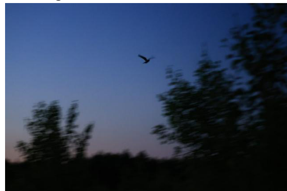
Ziegenmelker im Fläming

Zurück im Hotel blieb Zeit für eine kurze Erholung, bevor wir am Abend zur Ziegenmelker-Exkursion aufbrachen. An mehreren Stellen konnten wir die charakteristischen schnurrenden Gesänge hören, und einigen Teilnehmern gelang auch die Beobachtung dieses faszinierenden Nachtvogels aus unmittelbarer Nähe.