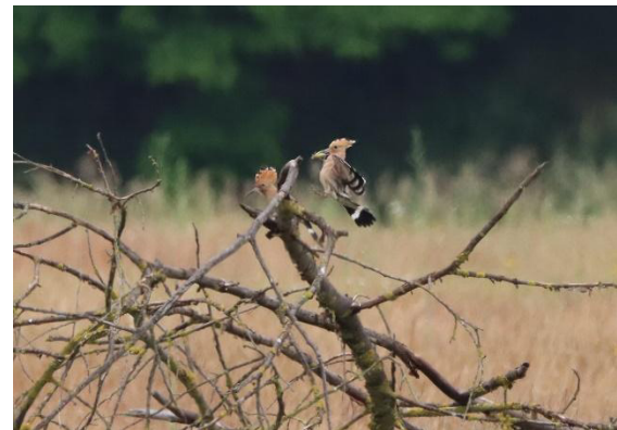
Wiedehopf im Fläming

Anschließend kehrten wir zur Abschlussuppe ins Hotel zurück. Zwei Teilnehmer waren im Laufe des Tages bereits etwas früher abgereist. Für die übrige Gruppe endete die Reise mit der Verabschiedung am Bahnhof.