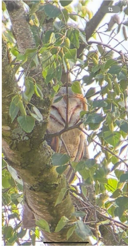
Schleiereule Wilder Fläming 2026