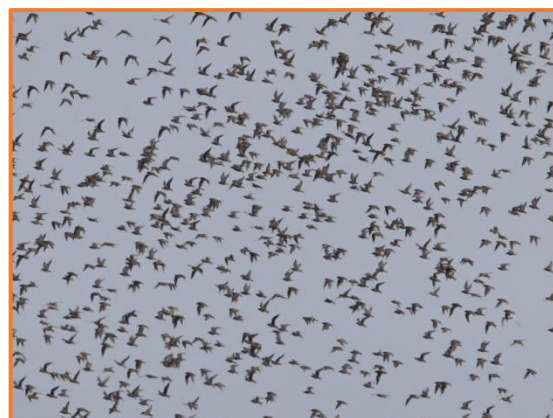
Goldregenpfeifer (J. Kundler)