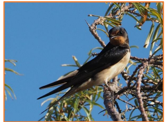
Rauchschwalbe (A. Wölk)