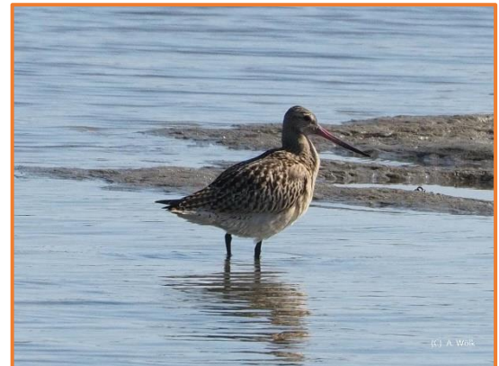
Pfuhschnepfe (A. Wölk)