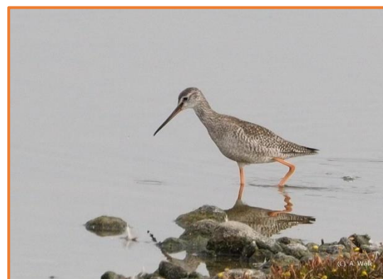
Dunkler Wasserläufer(A. Wölk)