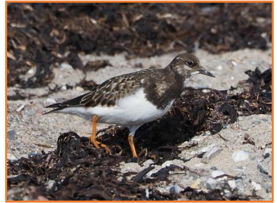
Steinwälzer (A. Wölk)