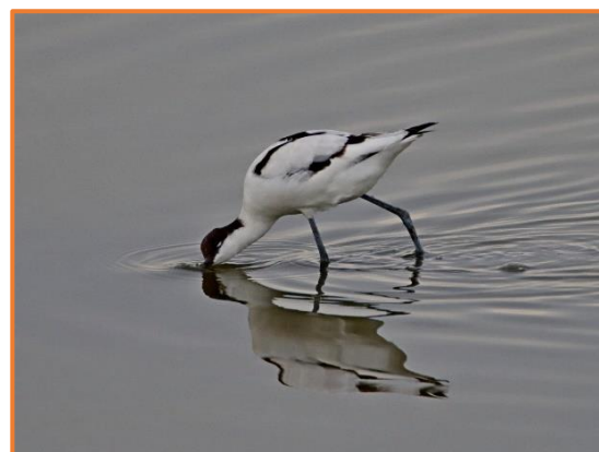
Säbelschnäbler (J. Kundler)