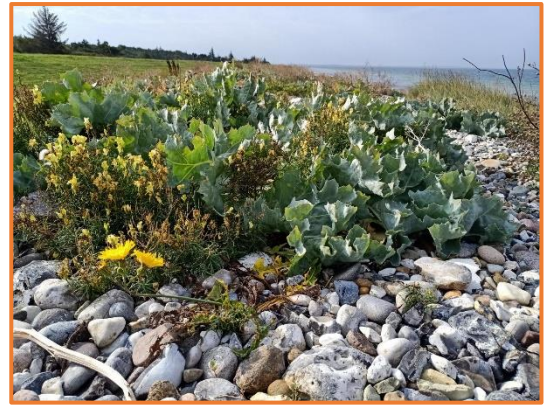
Strandwall (S. Lilje)