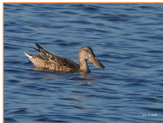
Löffelente (A. Wölk)