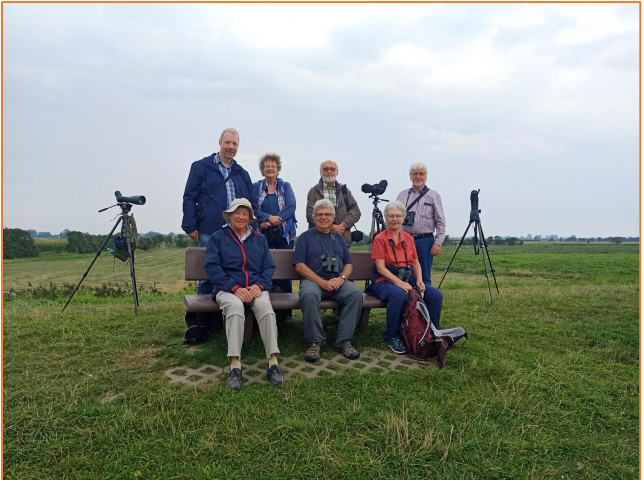
Reisegruppe (S. Lilje)