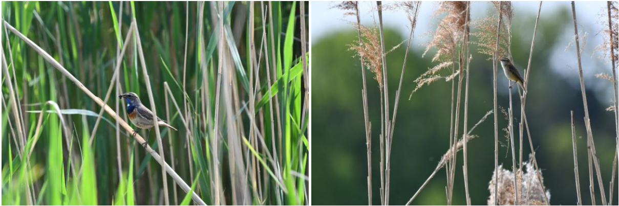
Weißsterniges Blaukehlchen und Schilfrohrsänger: Fotos von Christiane Hergl

Zum Mittagessen kehren wir in Gremsdorf in einem Biergarten ein. Gut gestärkt steuern wir unser zweites Beobachtungsgebiet an diesem Tag an: Auf den Spuren des ornithologisch engagierten Pfarrers Jäckel erkunden wir die Weiher um das Wasserschloss Neuhaus. Ein Nachtreiher späht vom Ufer aus nach Beute im Wasser. Besonders präsentierfreudig ist heute der Kuckuck, der immer wieder über uns fliegt und sich vor uns im Baum niederlässt. Wir können sogar den eher unbekanntem blubbernden Ruf des Kuckucksweibchens vernehmen. In der Eiche über uns ist der unauffällige Ruf des Grauschnäppers zu vernehmen. Mit viel Geduld und Konzentration können wir kurz einen Blick auf ihn erhaschen.