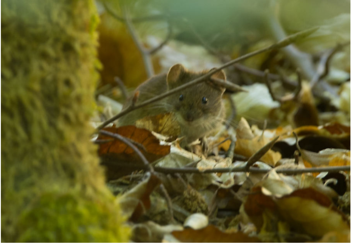
Gelbhalsmaus Der Naturwald „Woblitz“ Buchenwald Himmelpfort, Weitere Beobachtungen in Himmelpfort: Waldlaubsänger, Kleiber, Buntspecht, Tannenmeise, Rauchschwalben, Mauersegler, Haubentaucher, Stockente, Ringeltaube, Türkentaube, Zilpzalp, Rotmilan, Schwarzmilan, Gelbhalsmaus