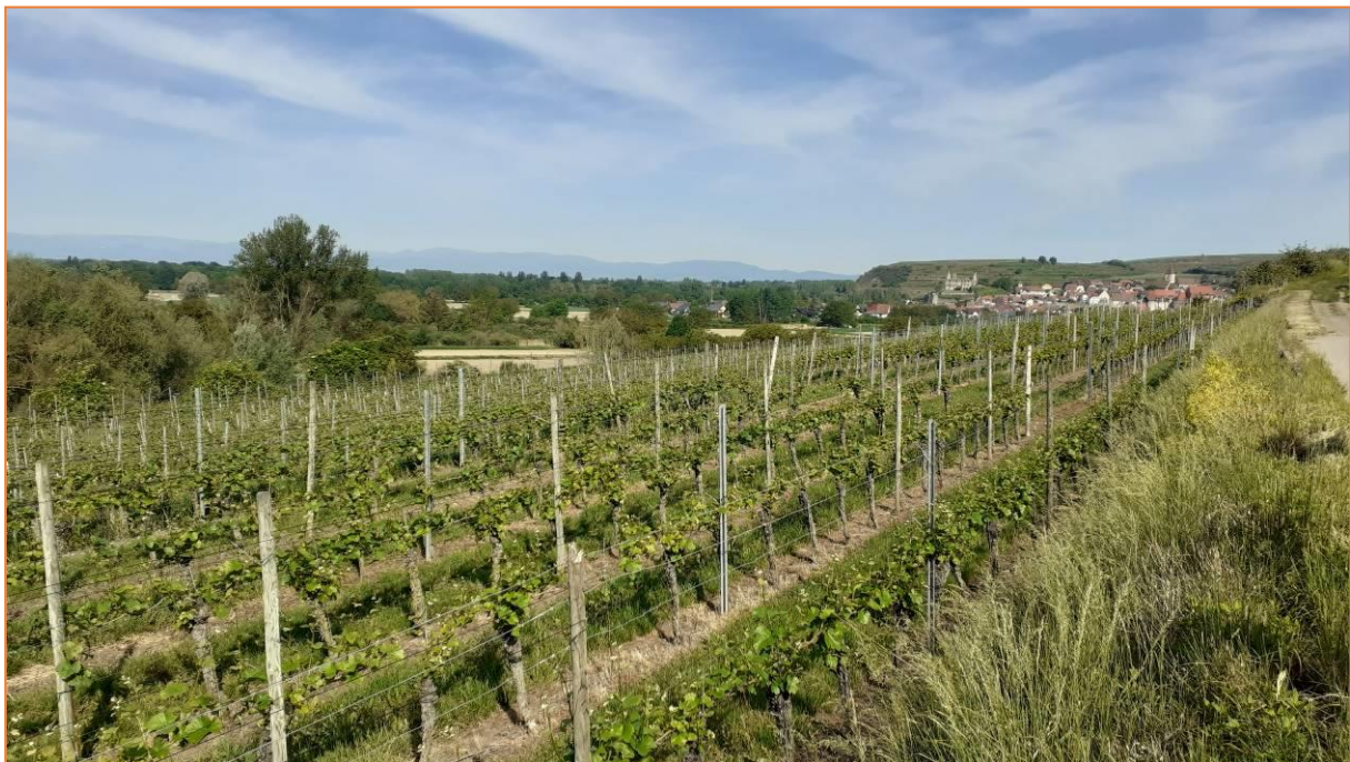
Blick auf Burkheim

Bevor wir uns dann trennen, genießen wir bei schönstem Wetter noch ein letztes Getränk im gemütlichen Hotelgarten in Altvogtsburg. Auf Wiedersehen im Kaiserstuhl!