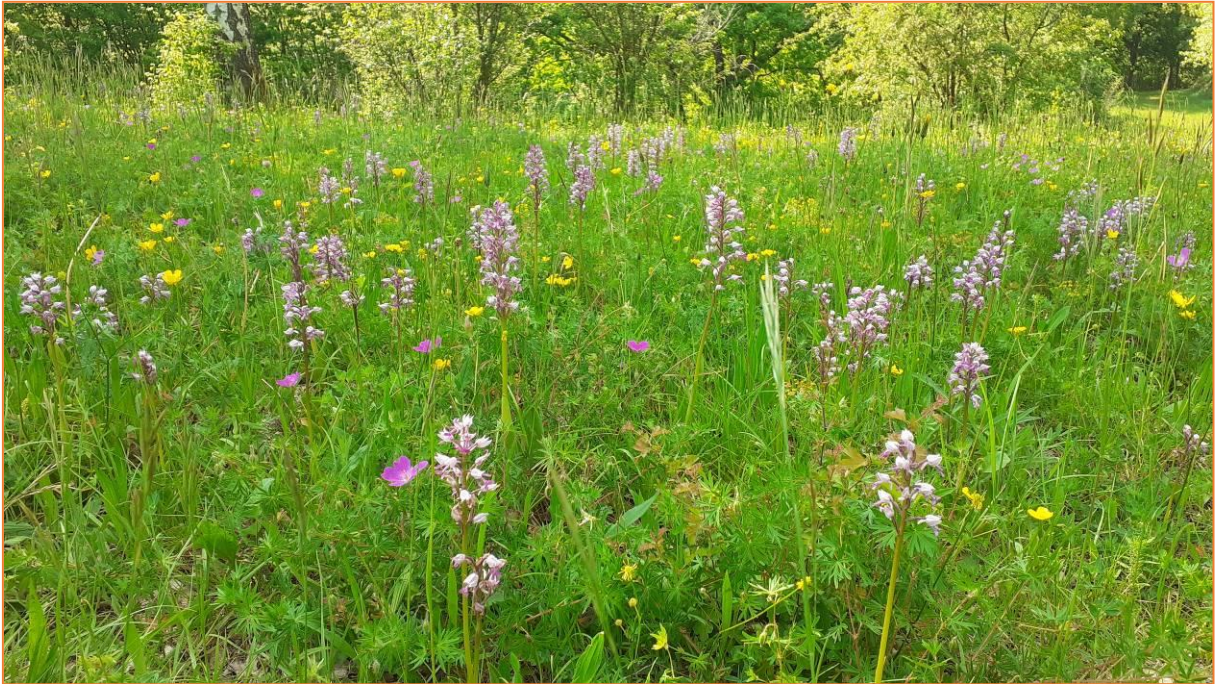
Orchideenwiese (oben), Hummel-Ragwurz (unten links), Purpur-Knabenkraut (unten rechts)