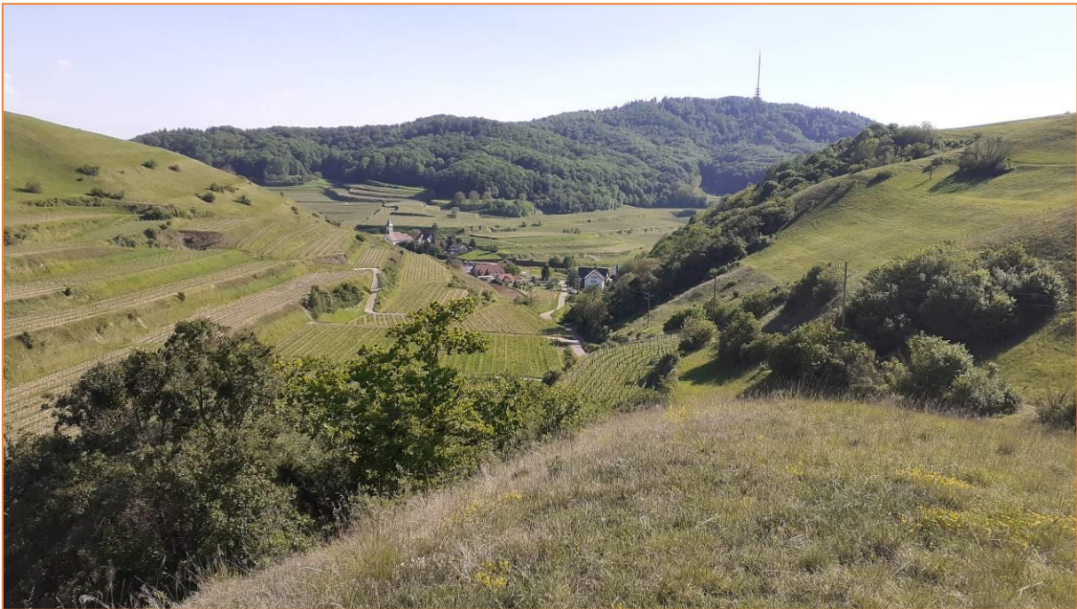
Blick auf Altvogtsburg

Der Kaiserstuhl beherbergt durch sein mildes Klima und die geographische Lage einige spezielle Tier- und Pflanzenarten. Umrahmt von kulinarischen Genüssen gelangen uns Beobachtungen einiger dieser Besonderheiten.