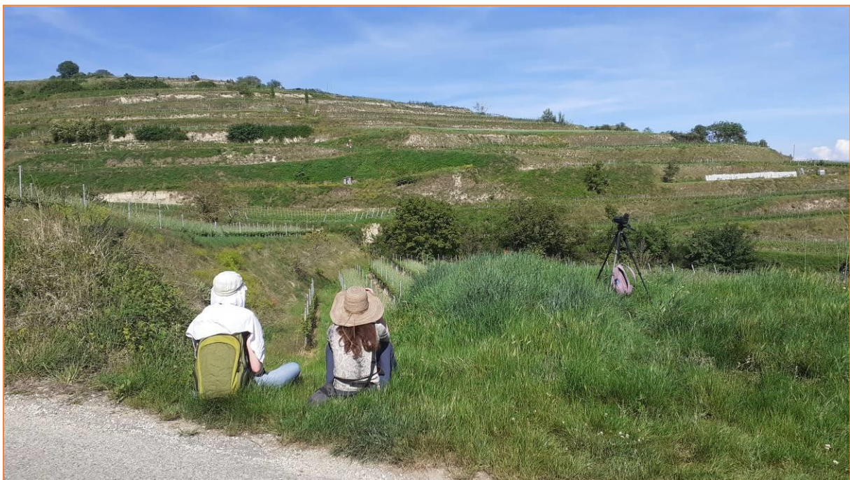
Entspanntes warten auf den Wiedehopf