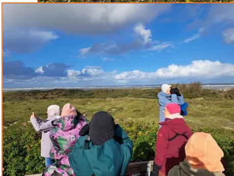
Blick von der Aussichtsdüne

Über die Norddünen geht es weiter zum Nordstrand beim Strandcafé Seeblick. Wir blicken über den weiten Sandstrand in Richtung offene Nordsee. Sanderlinge rennen entlang des Spülsaums und einzelne Basstölpel und Mittelsäger sind weit draußen über dem Meer unterwegs. Anschließend, auf den großflächigen Wiesen des Flughafens, sind große Trupps von Goldregenpfeifern zu sehen. Auch etliche Kiebitze, Brachvögel und eine Bekassine suchen hier nach Nahrung und wollen unbedingt auf unser Artenliste.