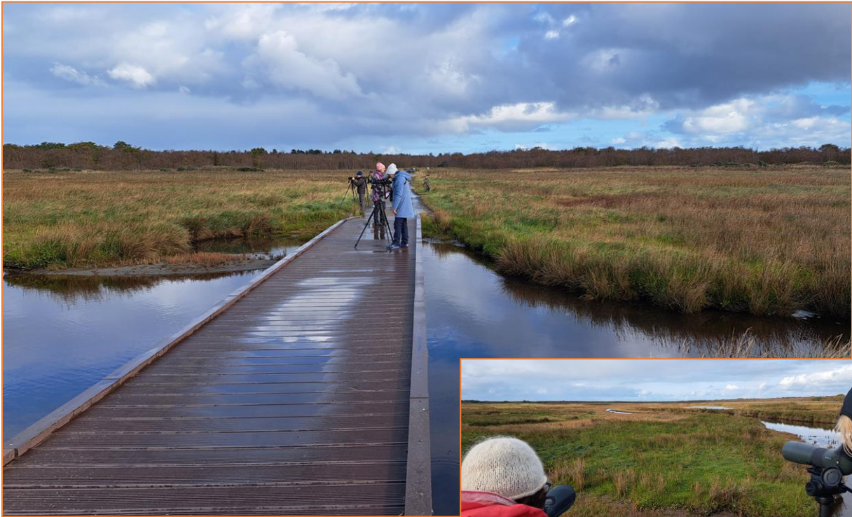
Loopdeelenweg über die Salzwiesen