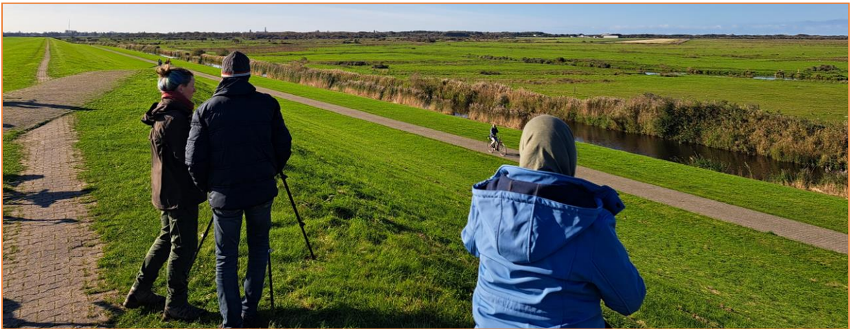
Wiesen und Weiden am Tuskendörsee (oben), Teerdamm am Südstrand (unten)