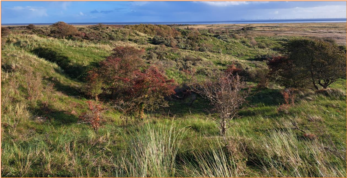
Blick über die malerische Dünenlandschaft