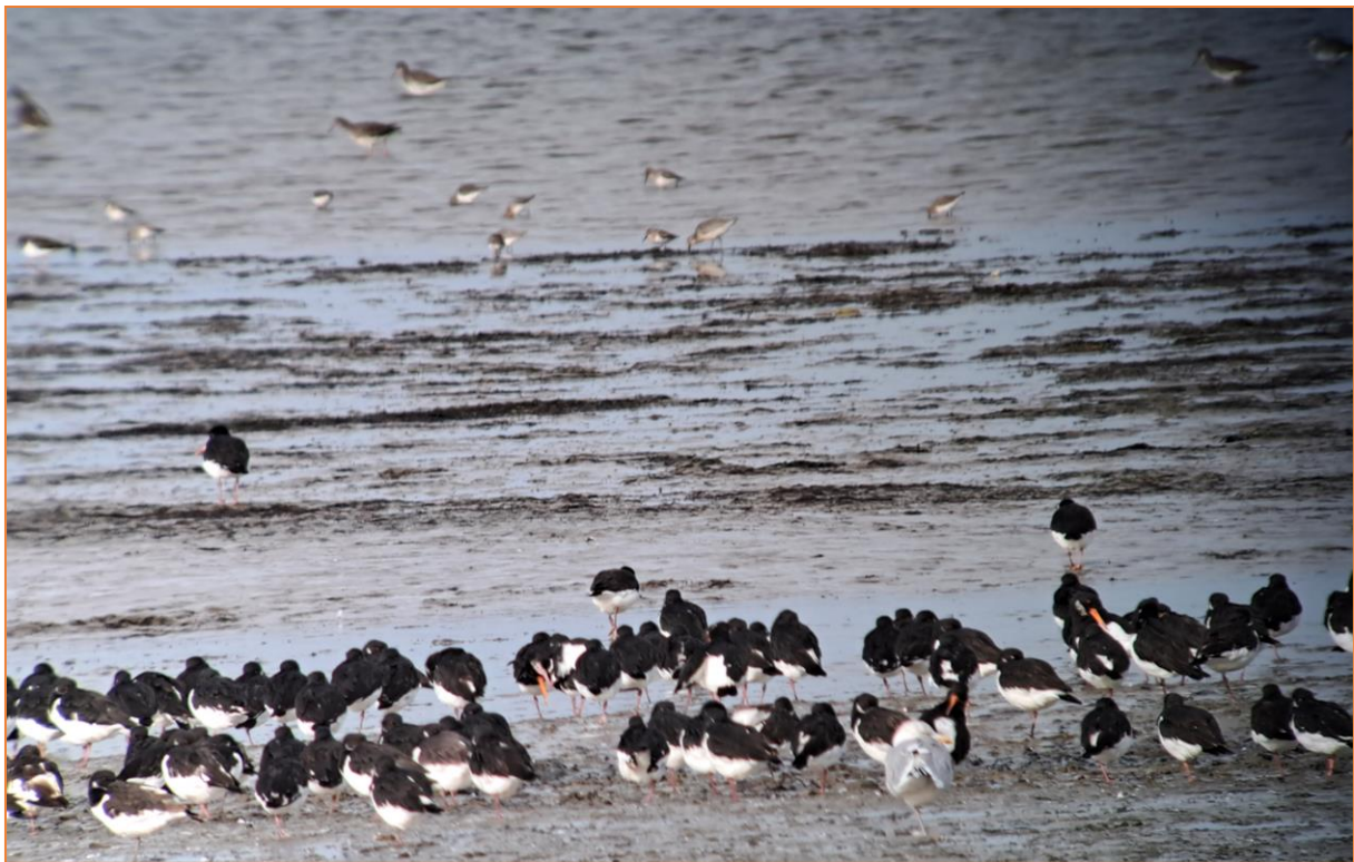
Getümmel am Reededeich (Austernfischer, Silbermöwe, Alpenstrandläufer, Rotschenkel)