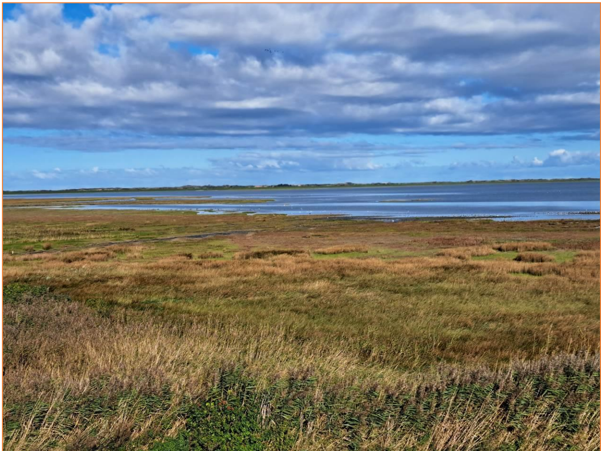
Blick vom Reededamm über Salzwiesen zum Wattenmeer

Die Insel Borkum liegt inmitten des Wattenmeeres, einem der weltweit wichtigsten Rastplätze für den Vogelzug. Umrahmt von kulinarischen Genüssen besuchten wir die besten Beobachtungspunkte auf der größten und westlichsten ostfriesischen Insel.