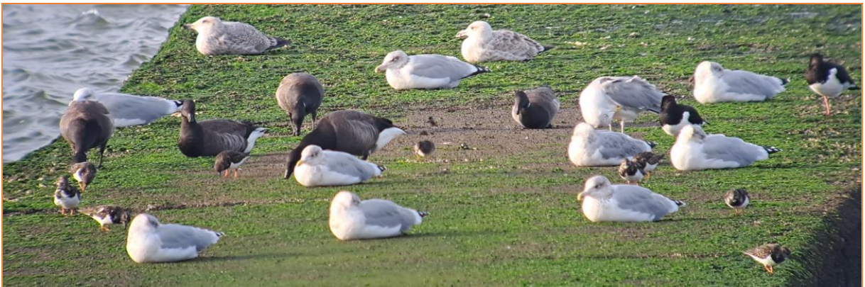
Silbermöwe, Ringelgans, Austernfischer, Steinwälzer und Bildmüttig ein Meerstrandläufer

Herzlichen Dank an die tolle Gruppe für die wunderbaren Tage auf Borkum!