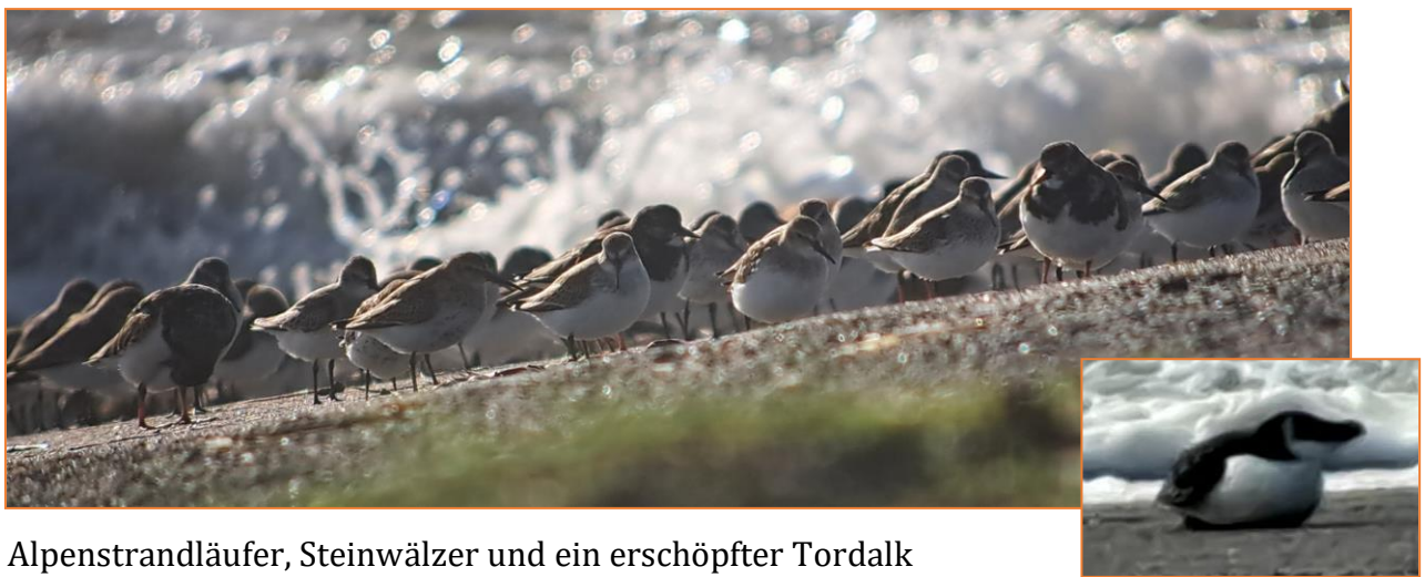
Alpenstrandläufer, Steinwälzer und ein erschöpfter Tordalk

Nach einem guten Frühstück heißt es zuerst die Fahrräder für die nächsten Tage abzuholen. Ein steifer Nordwestwind bläst, die See ist aufgewühlt. Wir radeln entlang des Südstrands über den Teerdamm zu den Salzwiesen beim Loopdeelenweg. Sanderlinge tippeln entlang des Spülsaums und hinter dem Damm suchen etliche Limikole wie Sand- und Kiebitzregenpfeifer, Steinwälzer, Meer- und Alpenstrandläufer windgeschützte Bereiche. Ein wohl erschöpfter Tordalk ruht sich auf dem Damm aus und im Bereich der Salzwiesen zeigen sich Schwarzkehlchen, Strandpieper, Großer Brachvogel und eine weibchenfarbige Rohrweihe.