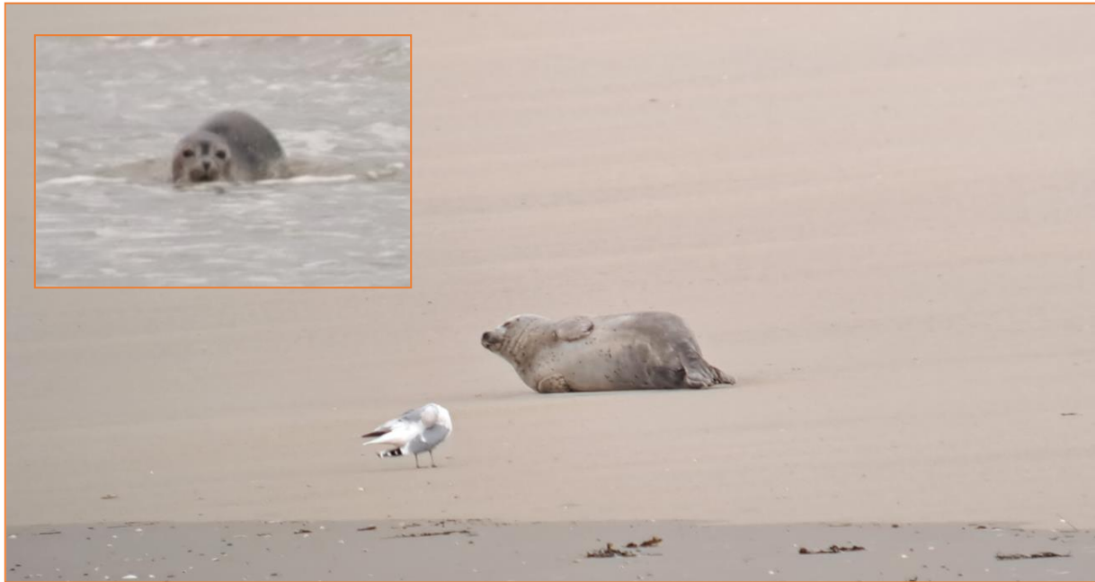
Seehund, Silbermöwe, Kegelrobbe

Heute wollen wir zum Hafen radeln um dort rund um die Hochwasserphase Limikolen zu beobachten. Unser Weg dahin führt uns zuerst über die Strandpromenade, die Binnenweiden und den Salzwiesen am Loopdeelenweg. Ein kurzer Stopp an der Promenade beschert uns neben einigen ersten Vögel auch zwei dicke Säugetiere. Eine Kegelrobbe und ein Seehund machen es sich gemütlich auf der Seehundbank „Hohes Riff“.