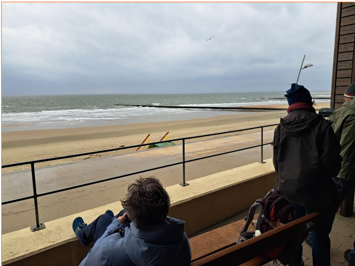
Vogelkiek am Strand von Borkum

Nach diesen ersten und schönen Eindrücken geht es zum leckeren Abendessen ins Restaurant Valentin's unweit unseres Hotels.