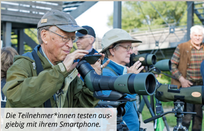
Die Teilnehmer*innen testen ausgiebig mit ihrem Smartphone.