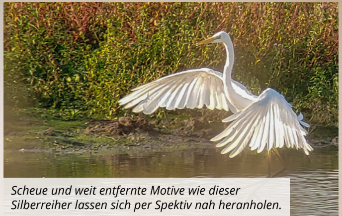
Scheue und weit entfernte Motive wie dieser Silberreiher lassen sich per Spektiv nah heranholen.

gel hat er sich als Hotspot für viele Vogelbeobachter*innen etabliert.